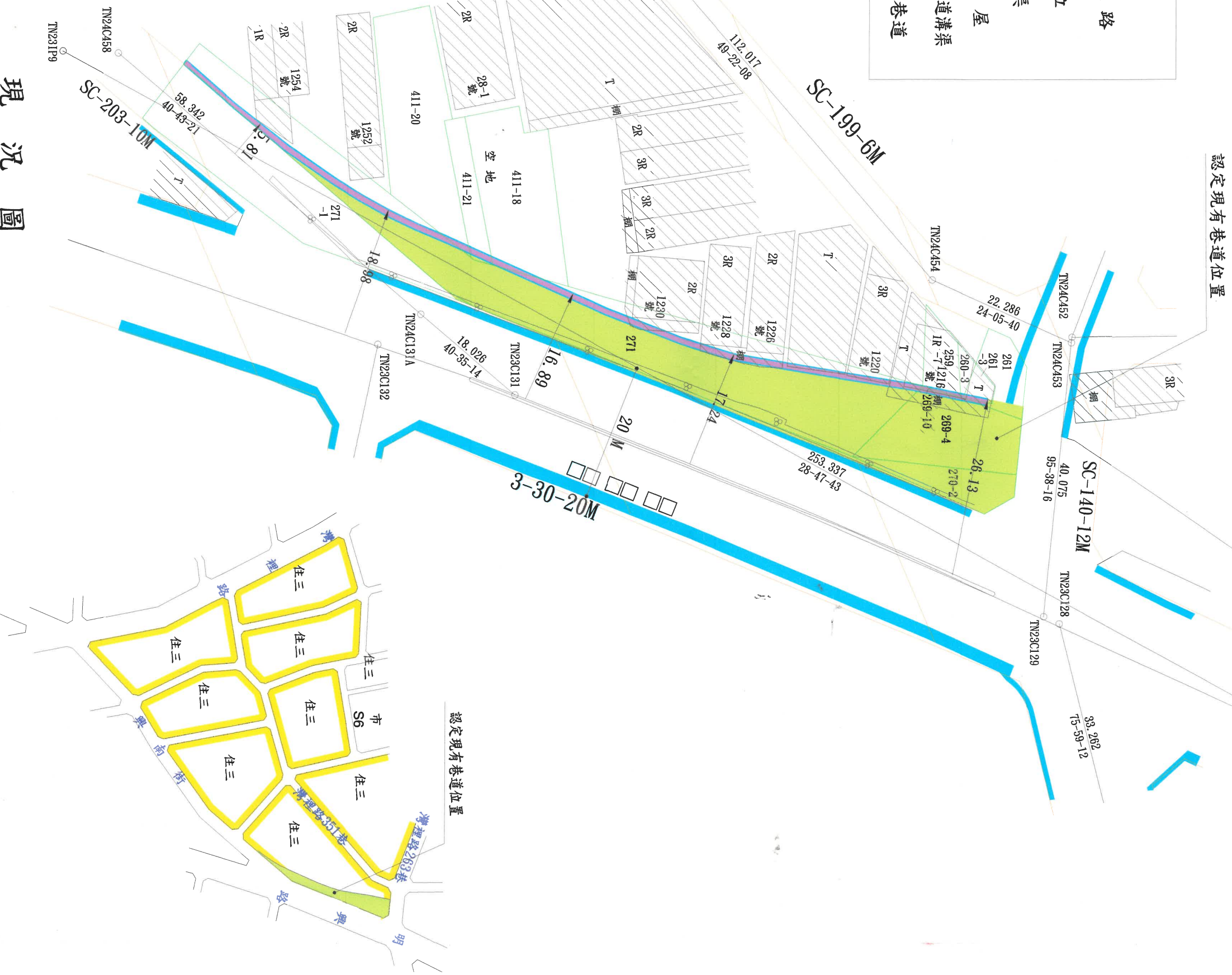
現況圖 比例尺: 1/600