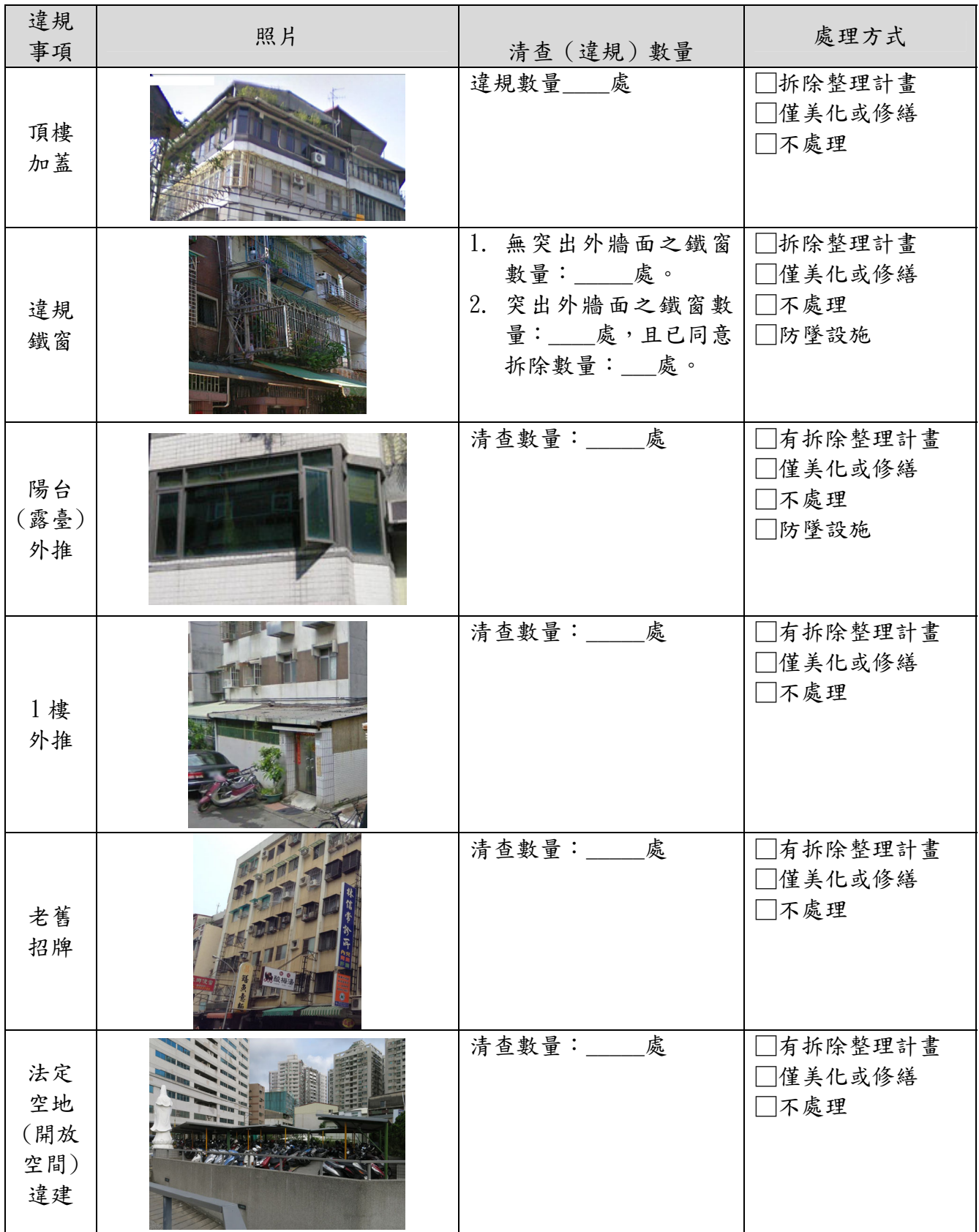
表 3-1 違建及違規物分析表