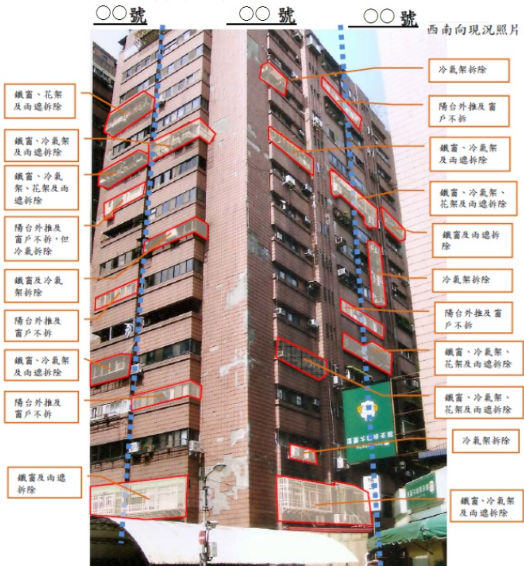
圖 3-1 違建及違規物拆除意願結果分析圖