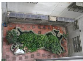
中庭水池易生病媒蚊