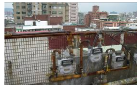
屋頂瓦斯表及管線