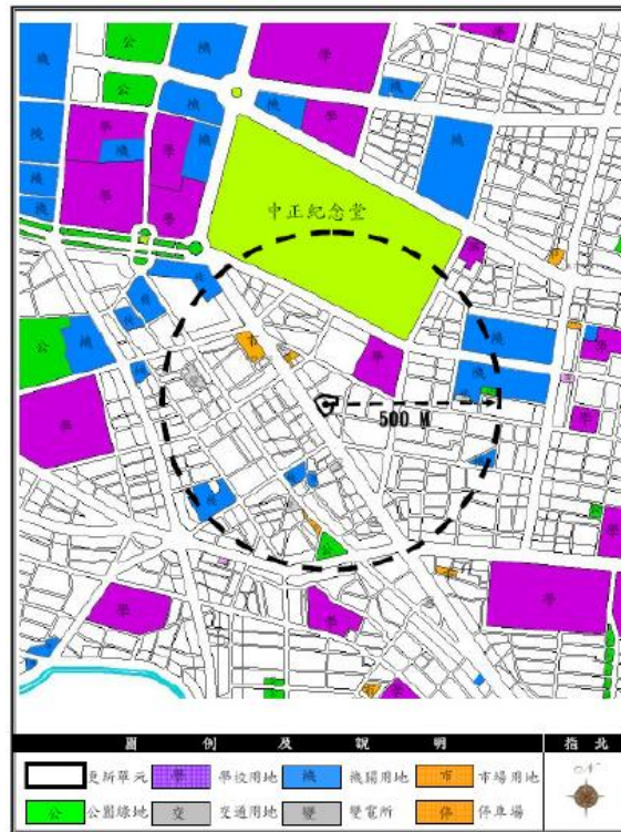
周邊公共設施及觀光景點分布圖

八、基地範圍半徑五百公尺內土地使用現況/交通系統現況/公共設施現況/觀光景點等地區發展狀況說明（請以文字說明並於圖面標明）：