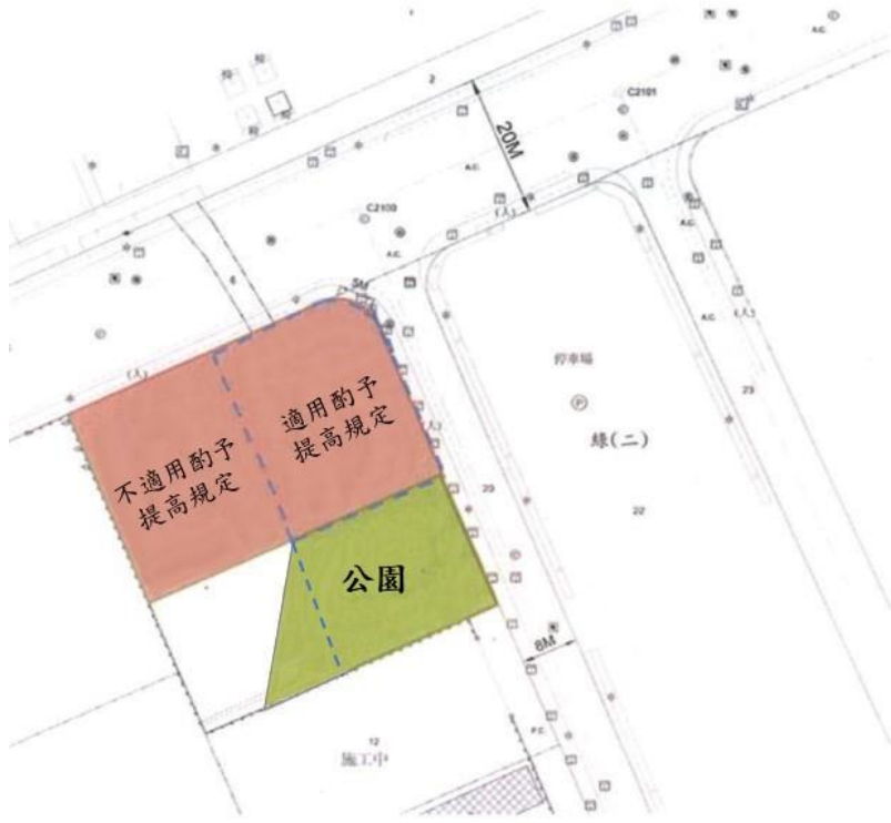
附圖二-二 得部分適用移入容積酌予提高之情形(水平切線)