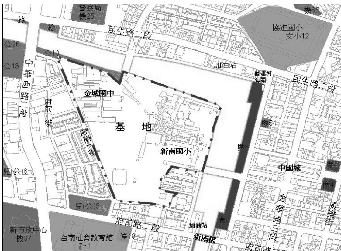
圖 運河星鑽更新地區範圍示意圖