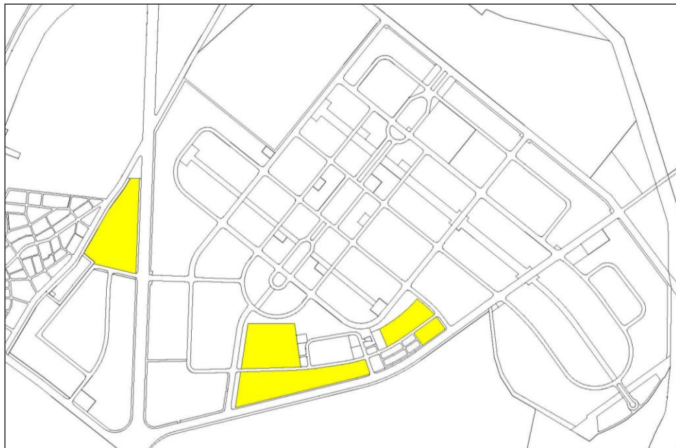
圖六-24 科技工業區住宅區整體規劃範圍示意圖