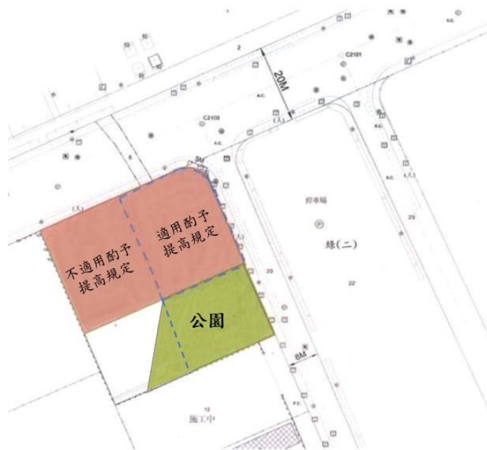
附圖二-二 得部分適用移入容積酌予提高之情形(水平切線)