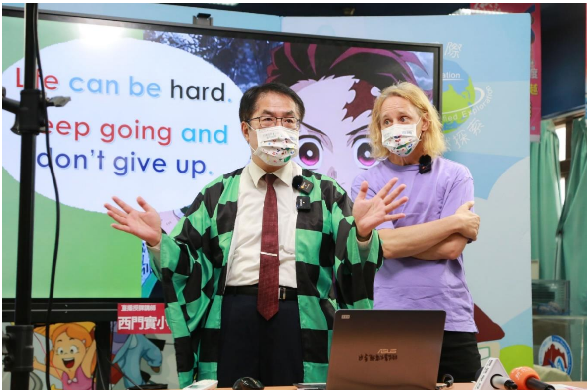
教育局打造台南公版直播課程國家隊，停課不停學創教育奇蹟