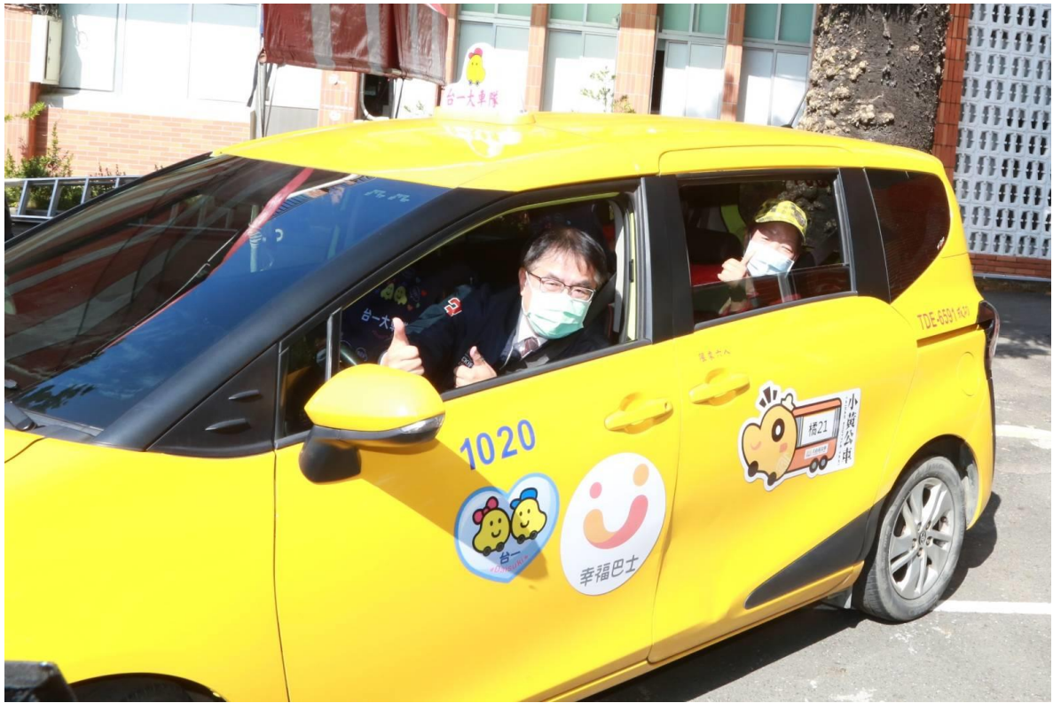
交通局深耕小黃公車路網，保障偏遠地區行的正義