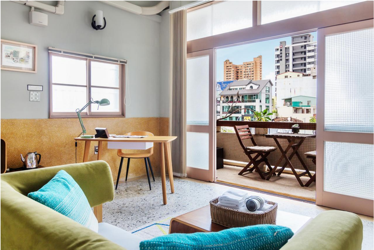
在臺南入住民宿讓人有家的感覺