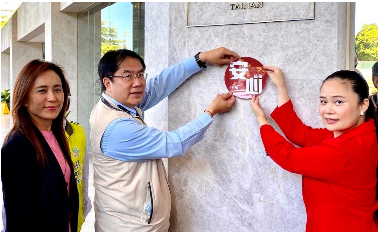
黃偉哲市長打造臺南成為安全安心的旅遊環境