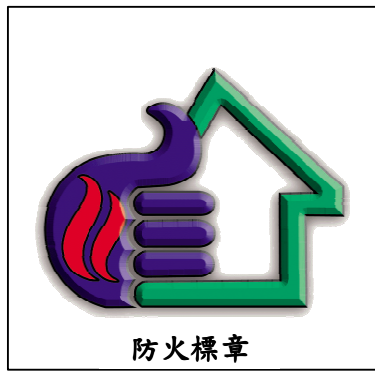
圖 1. 防火標章標誌