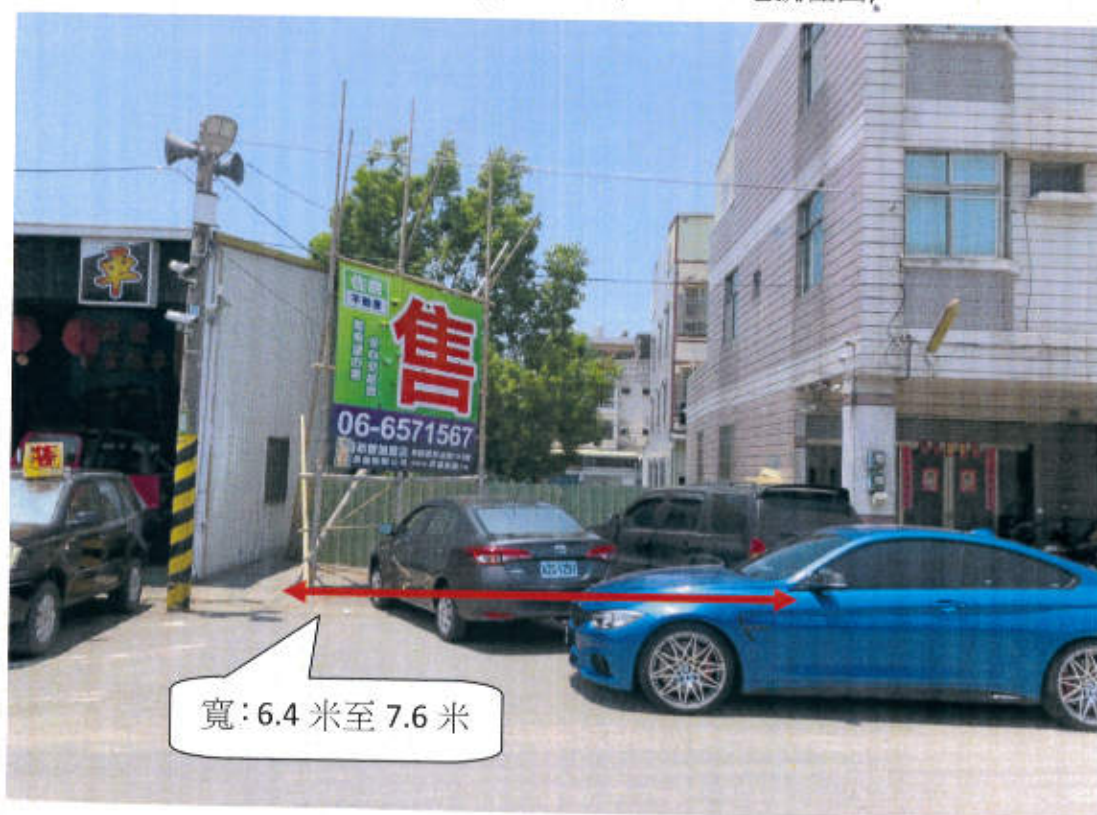
六甲區龜子港段 1658-4,1659-24,1699-14 地號等 3 筆土地(現有巷道) 現況照片(龜子港段 1658-4,1659-24,1699-14 地號往西)