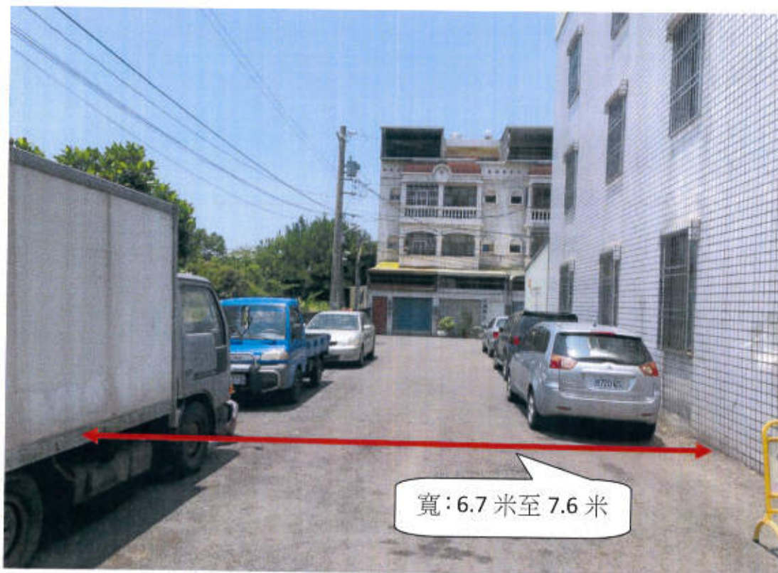
六甲區龜子港段 1658-4,1659-24,1699-14 地號等 3 筆土地(現有巷道) 現況照片(龜子港段 1659-24,1699-14 地號往西)