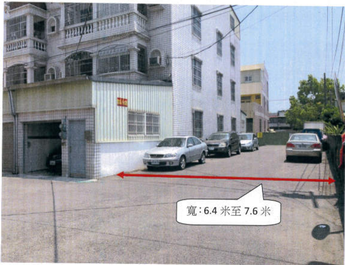
六甲區龜子港段 1658-4,1659-24,1699-14 地號等 3 筆土地(現有巷道) 現況照片(龜子港段 1658-4,1659-24,1699-14 地號往東)