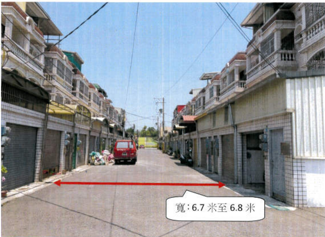
六甲區龜子港段 1658-4,1659-24,1699-14 地號等 3 筆土地(現有巷道) 現況照片(龜子港段 1659-24 地號往北)