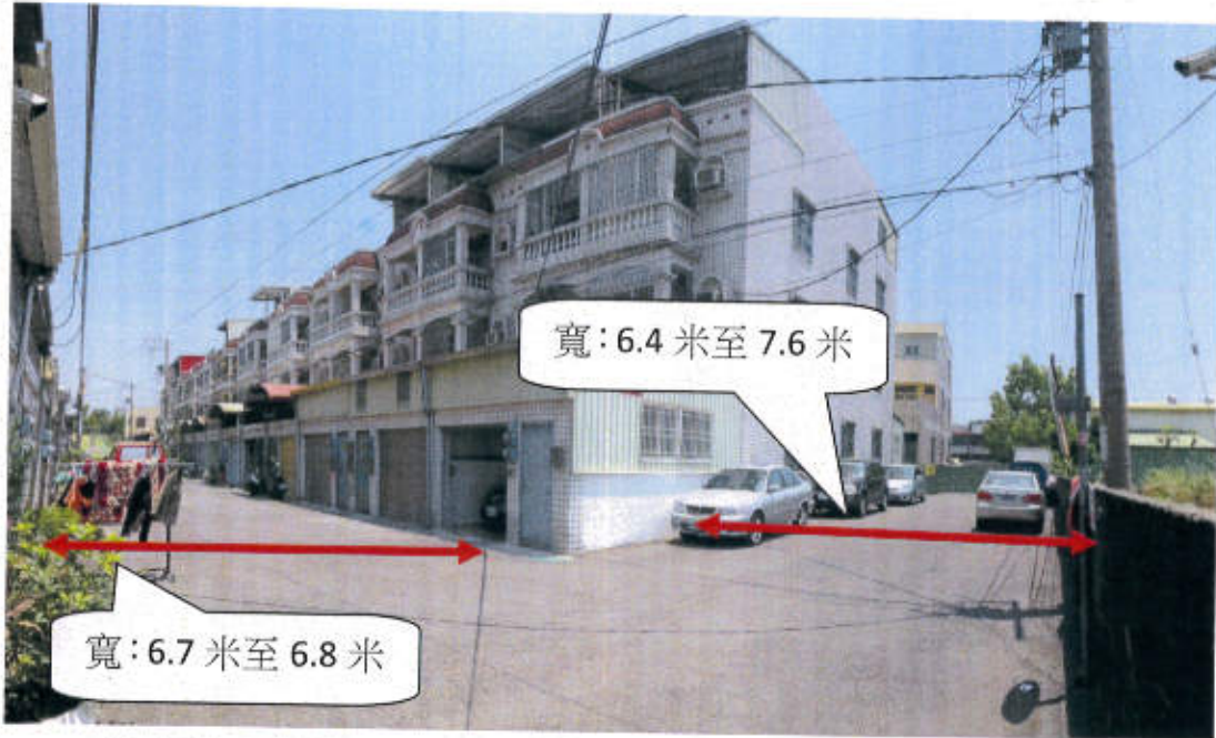
六甲區龜子港段 1658-4,1659-24,1699-14 地號等 3 筆土地(現有巷道) 現況照片(龜子港段 1658-4,1659-24,1699-14 地號往東及龜子港段 1659-24 地號往北)