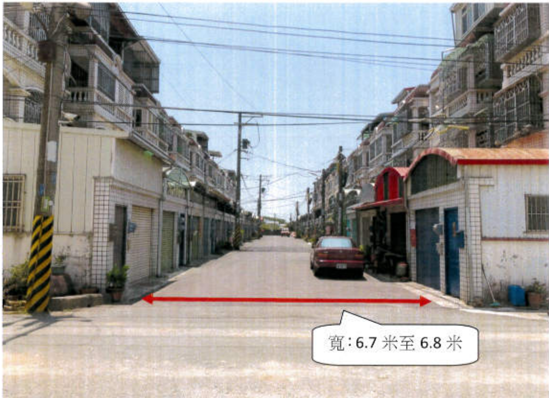
六甲區龜子港段 1658-4,1659-24,1699-14 地號等 3 筆土地(現有巷道) 現況照片(龜子港段 1659-24 地號往南)