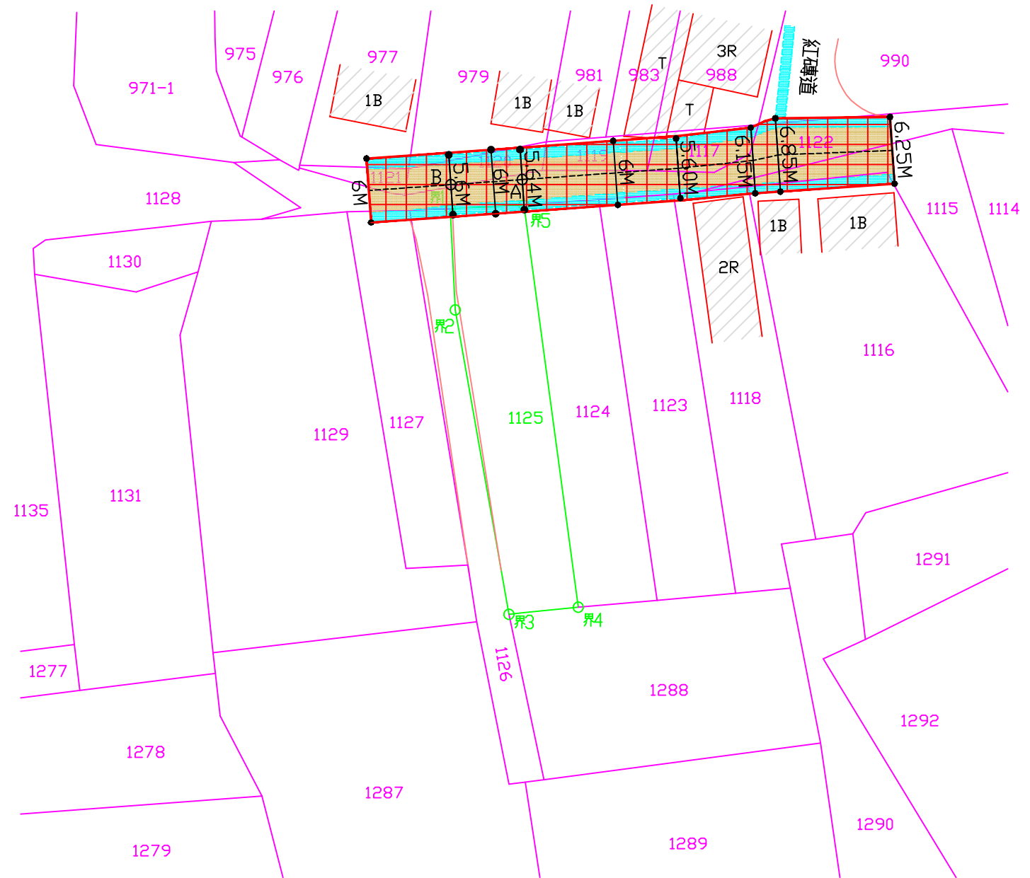
現況計劃圖 SCALE 1/500