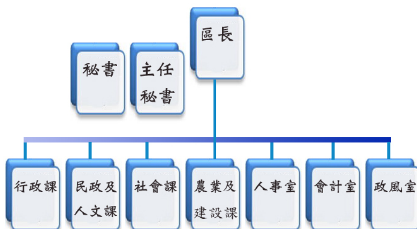
臺南市麻豆區公所組織系統圖

本區 102 年度業務單位計有：農業及建設課、社會課、民政及人文課、行政課等 4 課及人事室、會計室、政風室等 3 室。