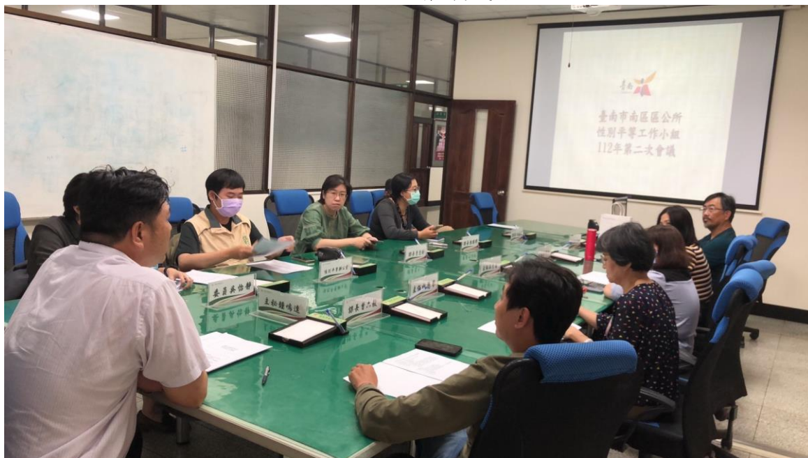
說明：鍾主秘主持會議中