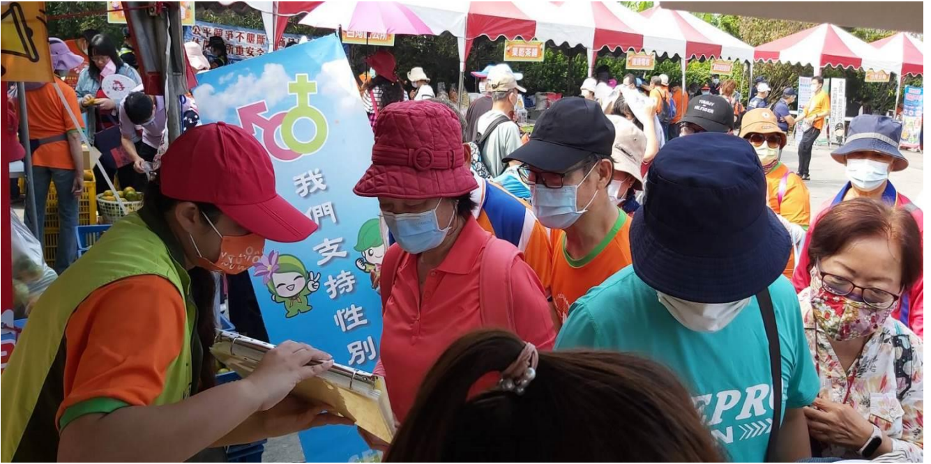
向民眾宣導性別平等知識