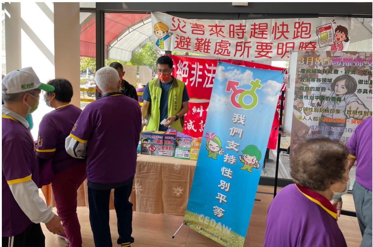
設攤進行性平宣導及有獎徵答活動