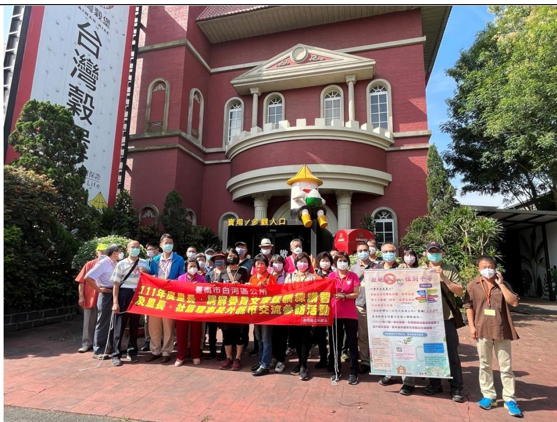
參加人員反應熱烈，提昇性平意識