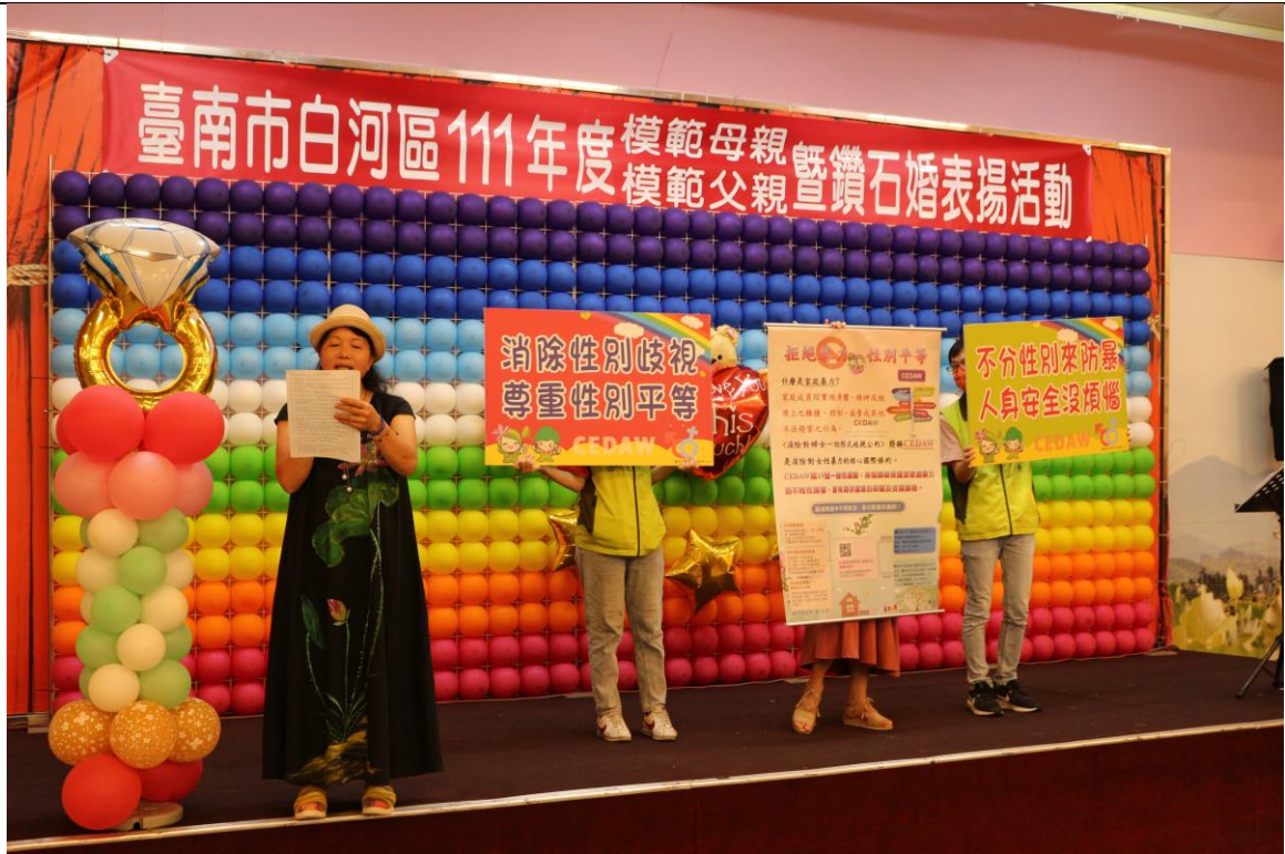
表揚活動向民眾宣導拒絕暴力尊重性別平等精神