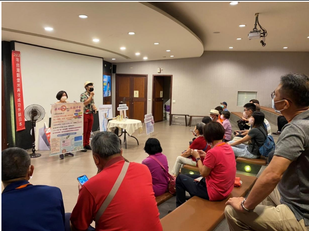
旅行社於中途休息時間再次宣導性平相關資訊