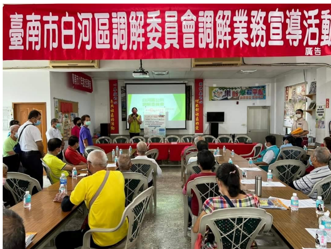
進行 CEDAW 及性別平等宣導