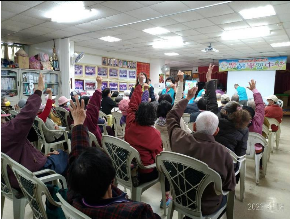
進行有獎徵答活動，民眾踴躍參與