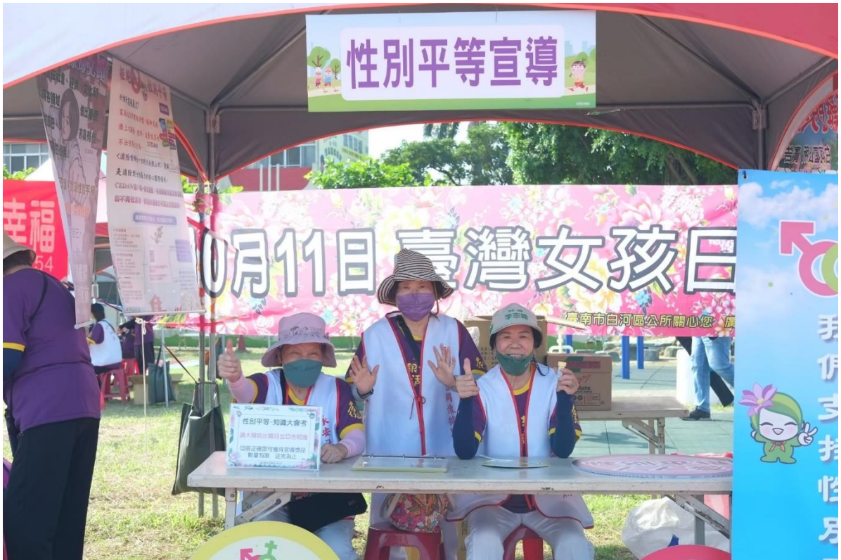
活動設攤向民眾宣導拒絕暴力性別平等精神