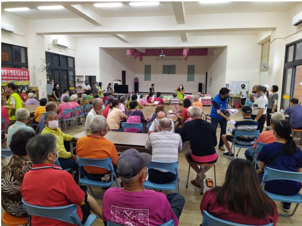
進行有獎徵答活動，加深民眾性平意識