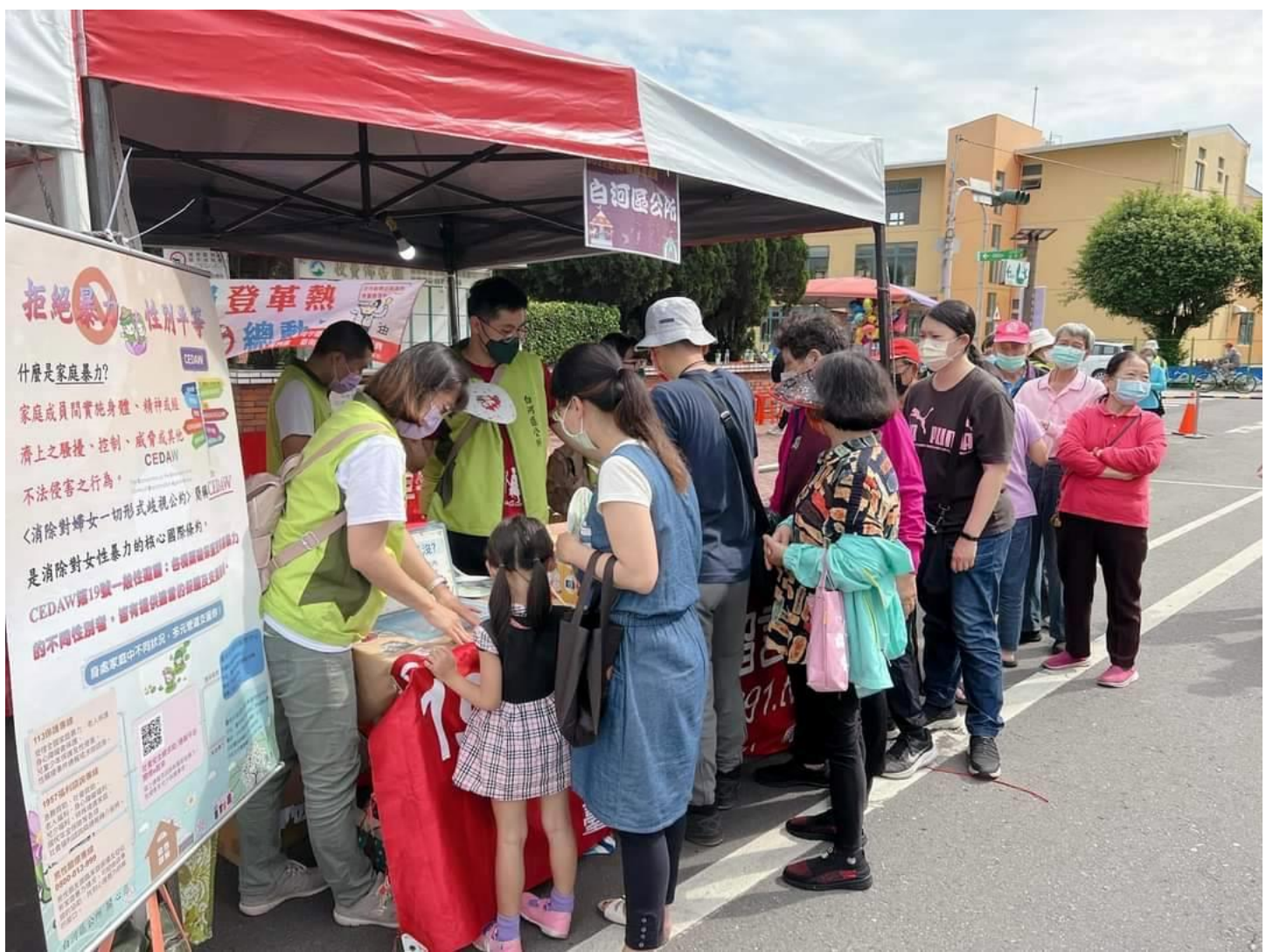
活動設攤進行宣導及有獎徵答