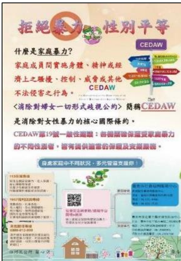
運用自製海報宣導 3 月 8 日國際婦女節意義、CEDAW 精神與性別平等概念