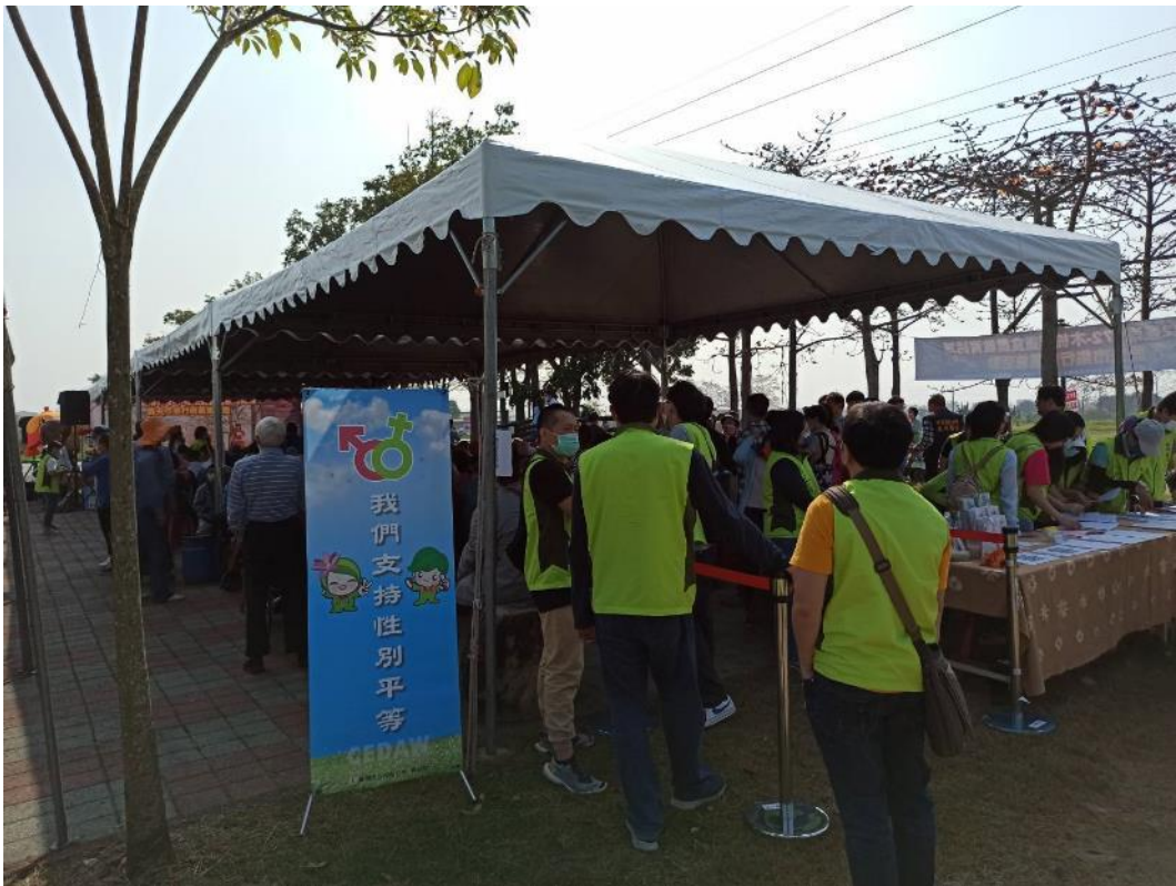
木棉花季系列活動開幕記者會現場民眾眾多