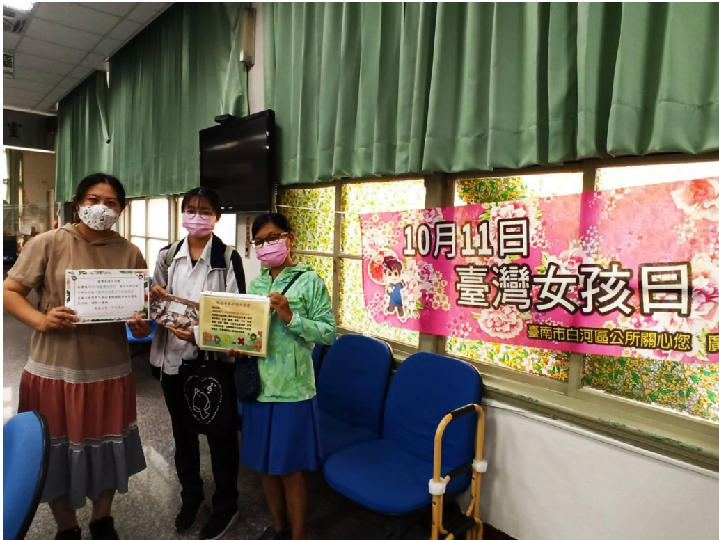
臺灣女孩日當日至公所洽公女孩參與有獎徵答活動