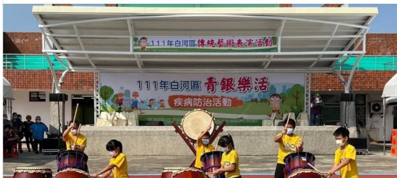
運用本所臉書發布活動訊息