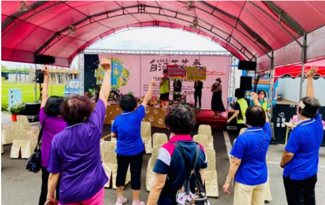
進行有獎徵答活動，加深民眾性平意識