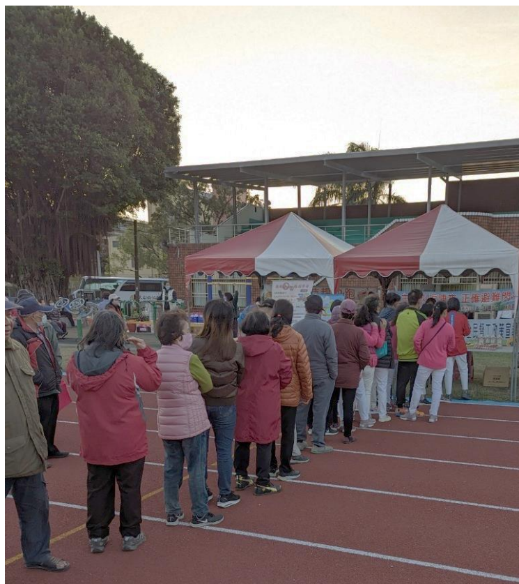
性平宣導及有獎徵答活動，民眾大排長龍