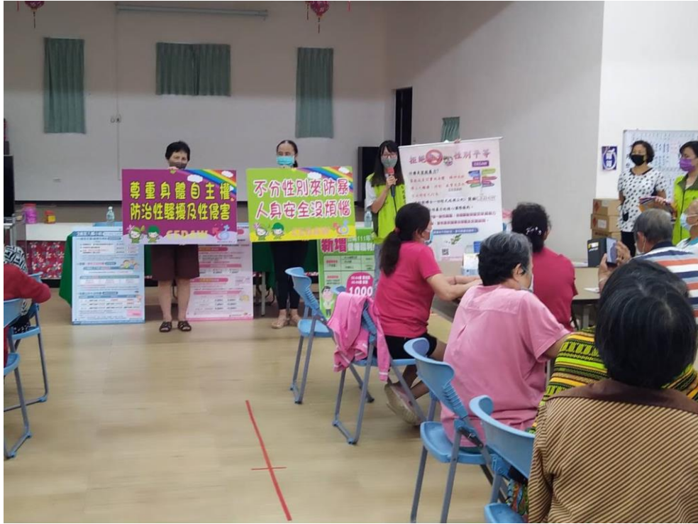
自製海報及手舉牌向民眾宣導拒絕暴力尊重性別平等精神