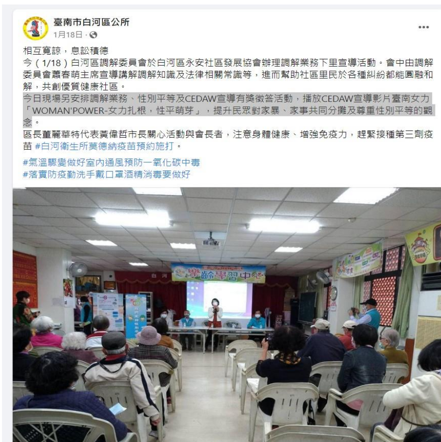
運用本所臉書發布活動訊息