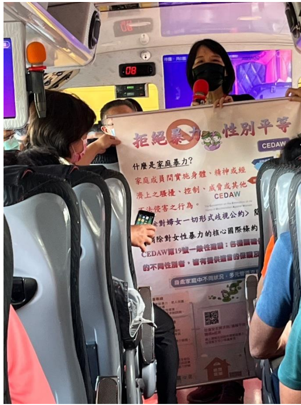
區長於遊覽車上宣導拒絕暴力性別平等精神