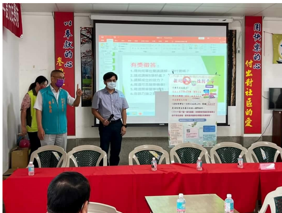
調解委員會主席說明性別平等增進家庭和諧減少糾紛