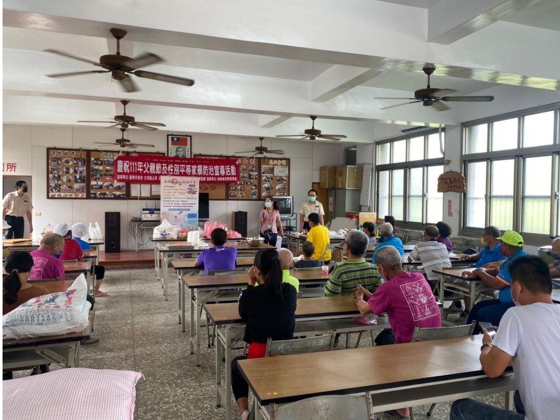
廣安社區性平宣導