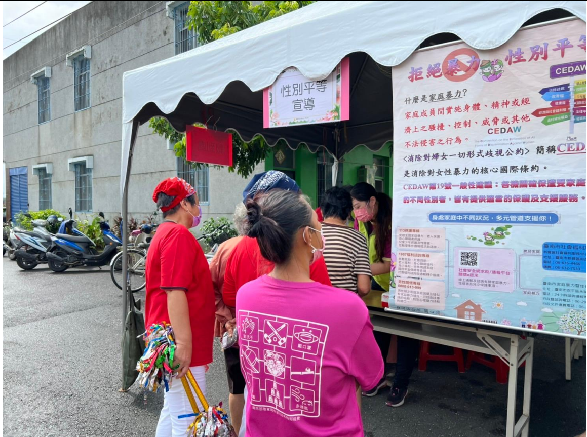
活動設攤向民眾宣導拒絕暴力性別平等精神