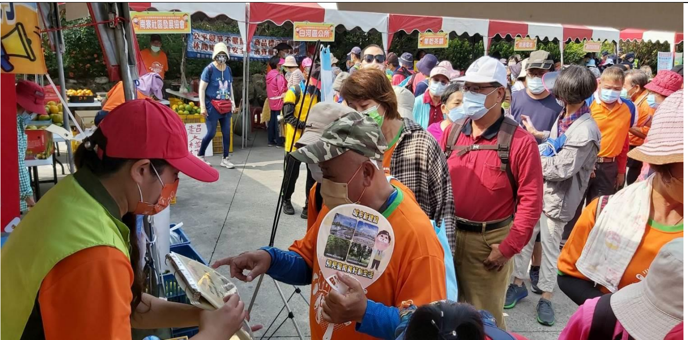
民眾回答性別平等有獎徵答