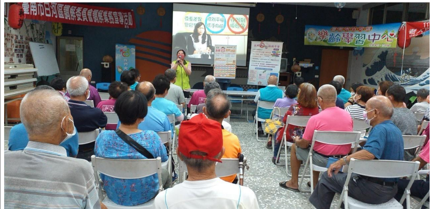
撥放臺南女力「WOMAN' POWER-女力扎根，性平萌芽」宣導影片