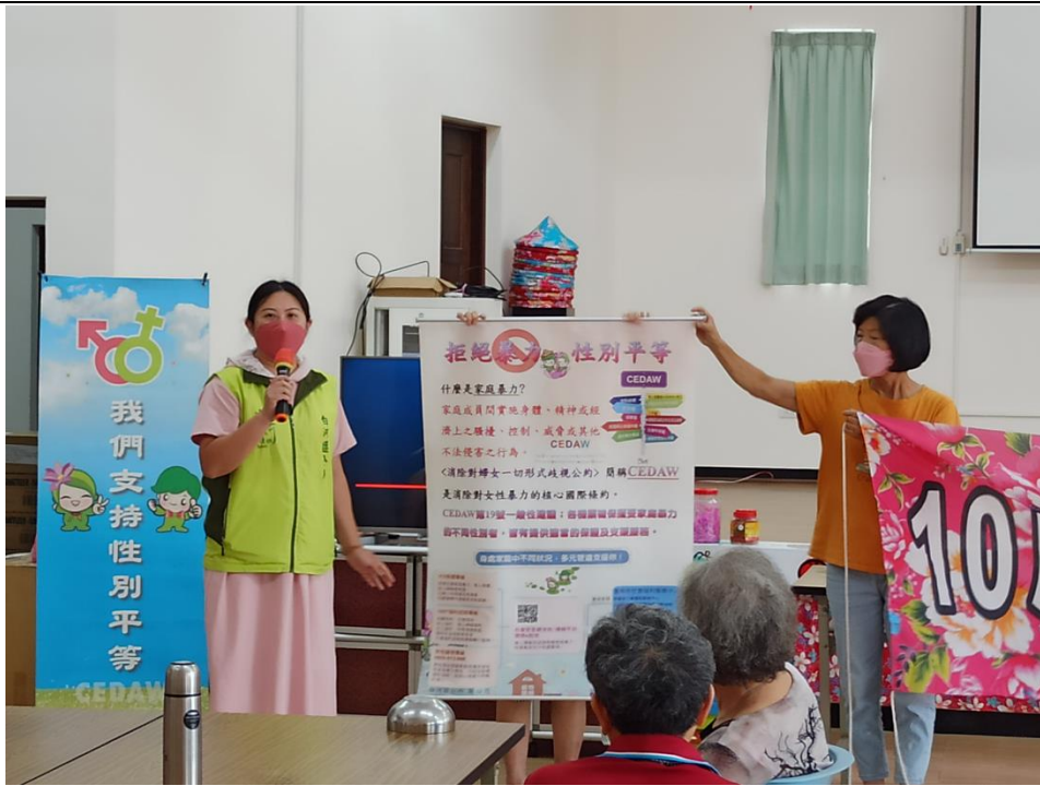
庄內社區性平宣導