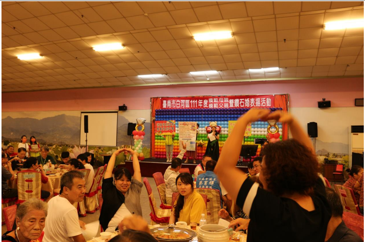
進行有獎徵答活動，加深民眾性平意識