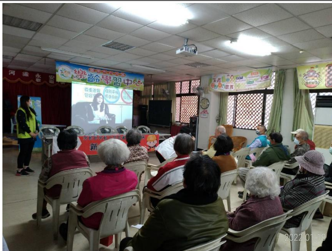
撥放臺南女力「WOMAN' POWER-女力扎根，性平萌芽」宣導影片