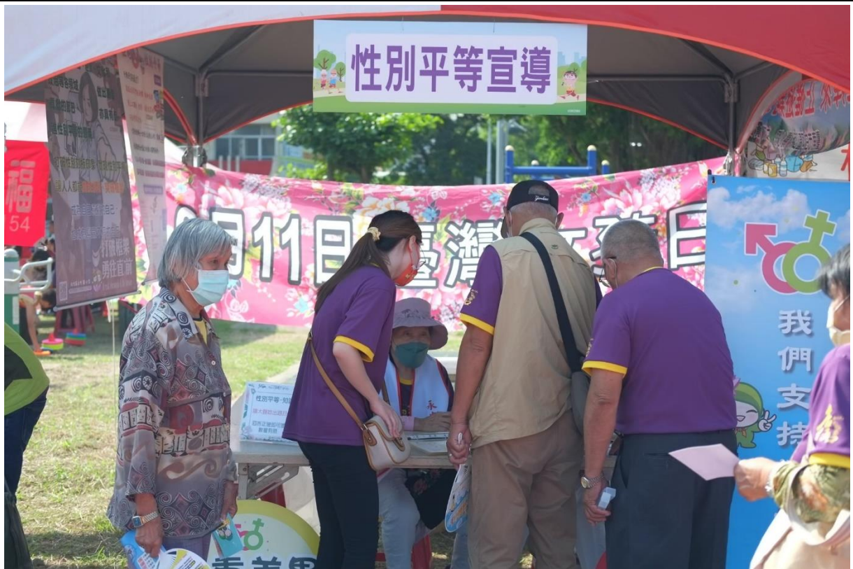
進行性平宣導及有獎徵答活動