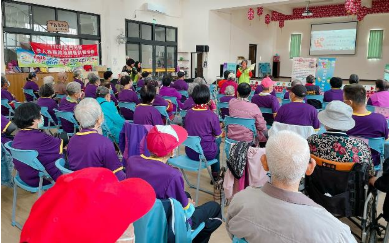
向民眾宣導拒絕暴力性別平等精神