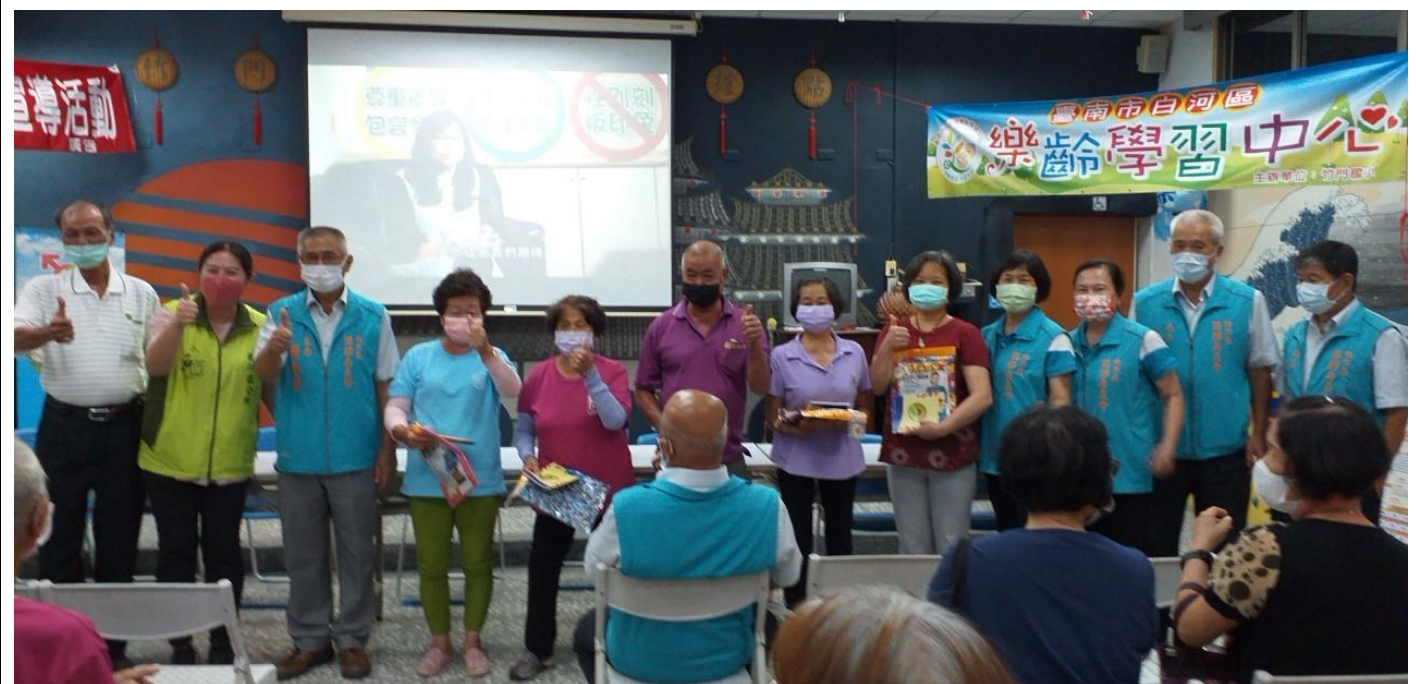
進行有獎徵答活動頒獎