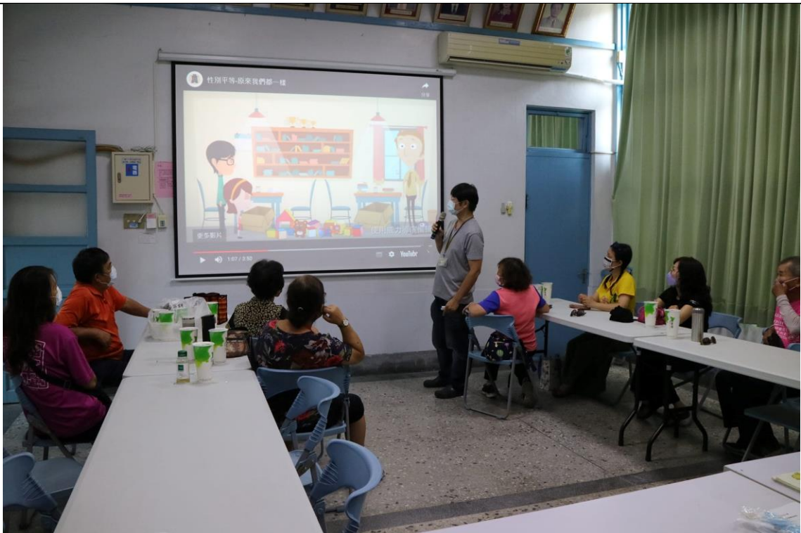
宣導拋棄重男輕女的觀念，並提升女性的社會價值