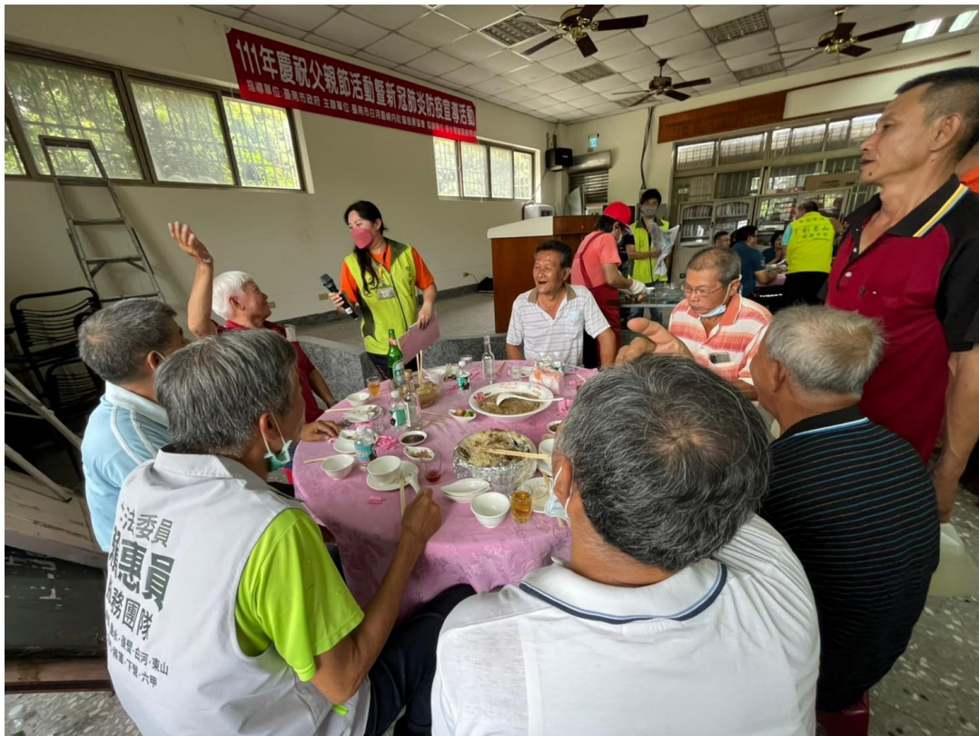
進行有獎徵答活動，加深民眾性平意識