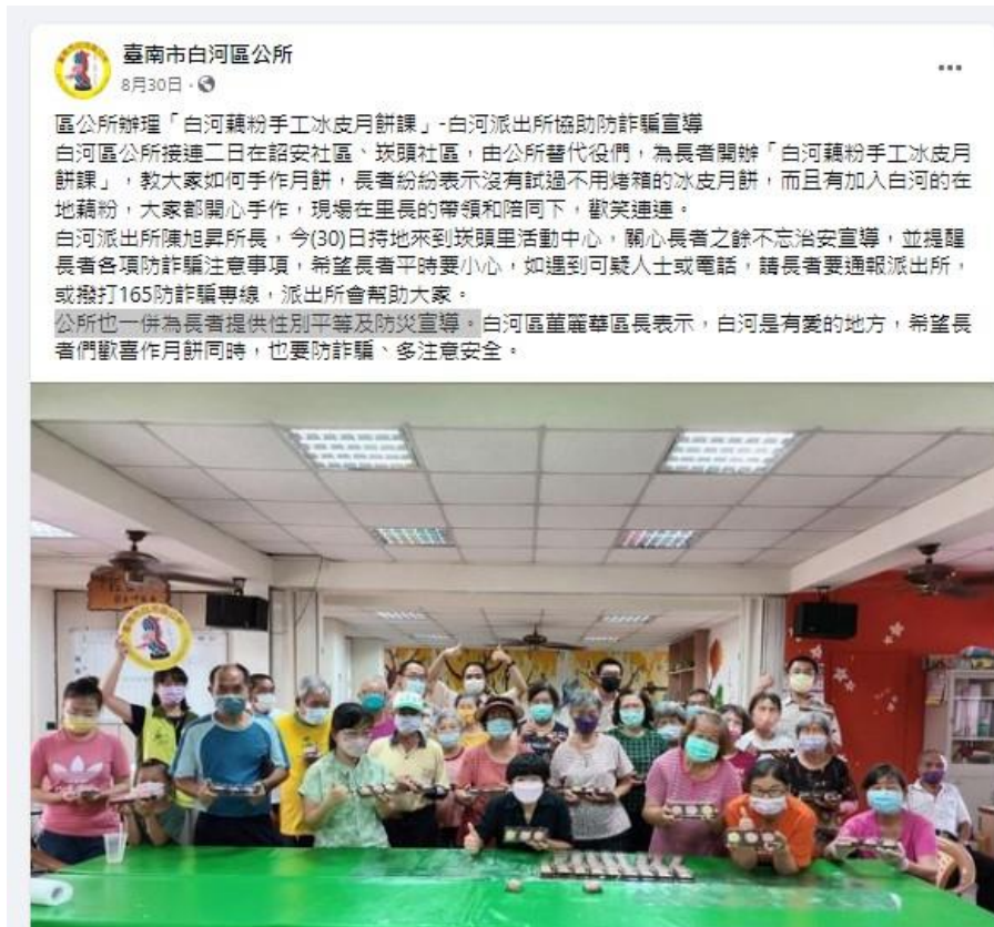
運用本所臉書發布活動訊息