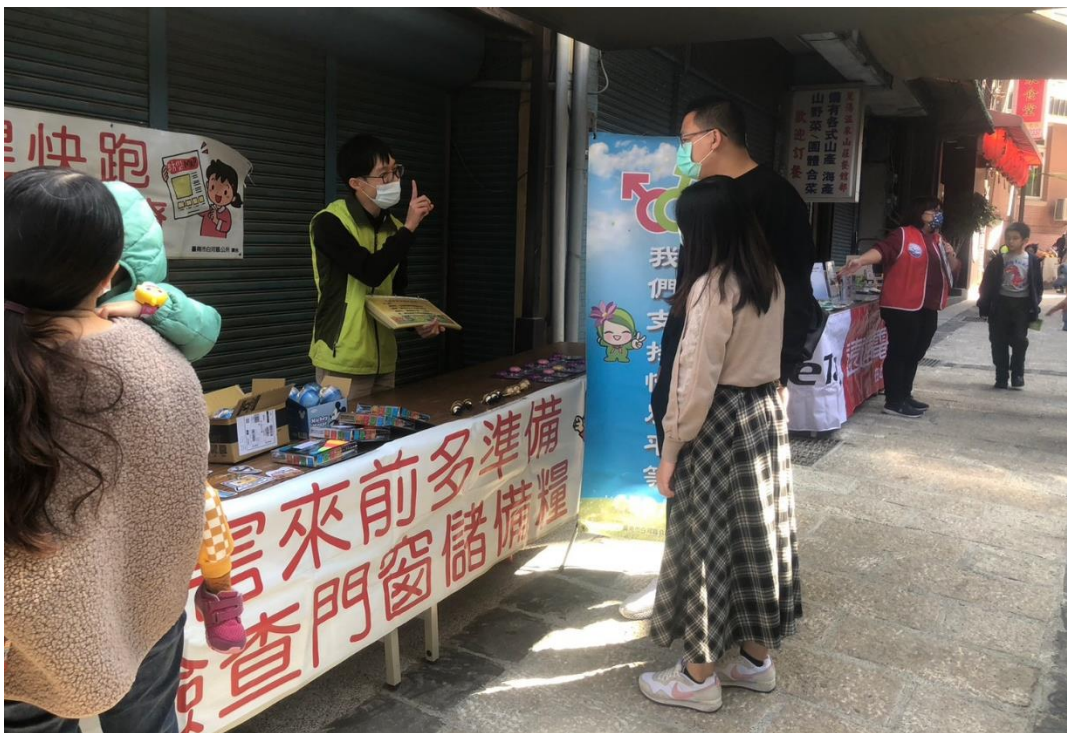
民眾回答性別平等有獎徵答