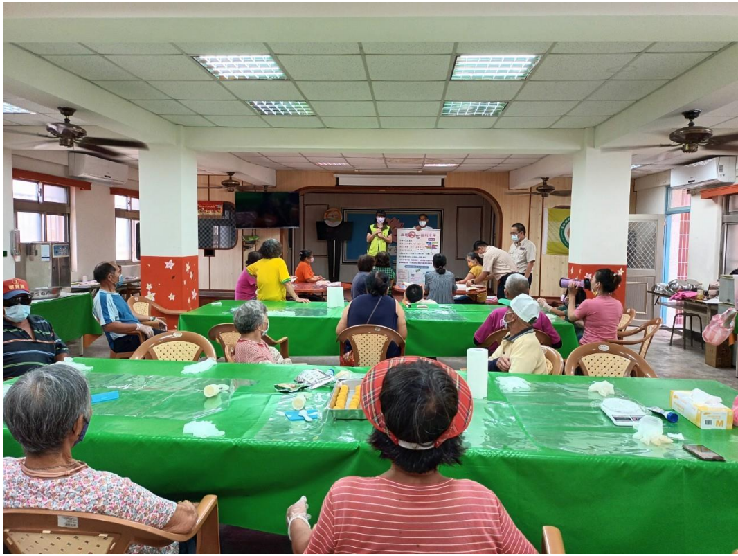
詔安社區性平宣導