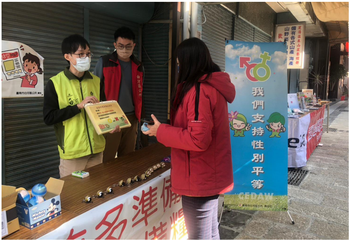
向民眾宣導性別平等知識