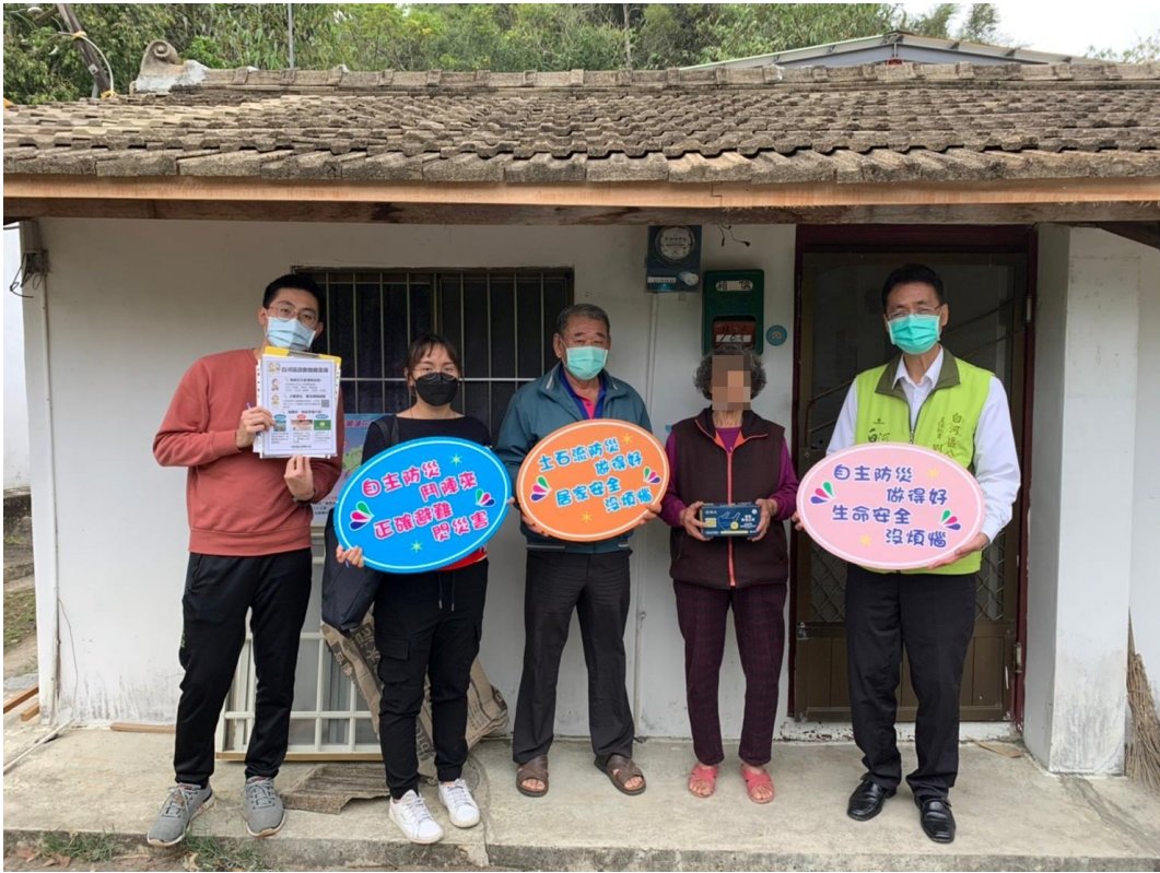
進行防災防疫及 CEDAW 宣導