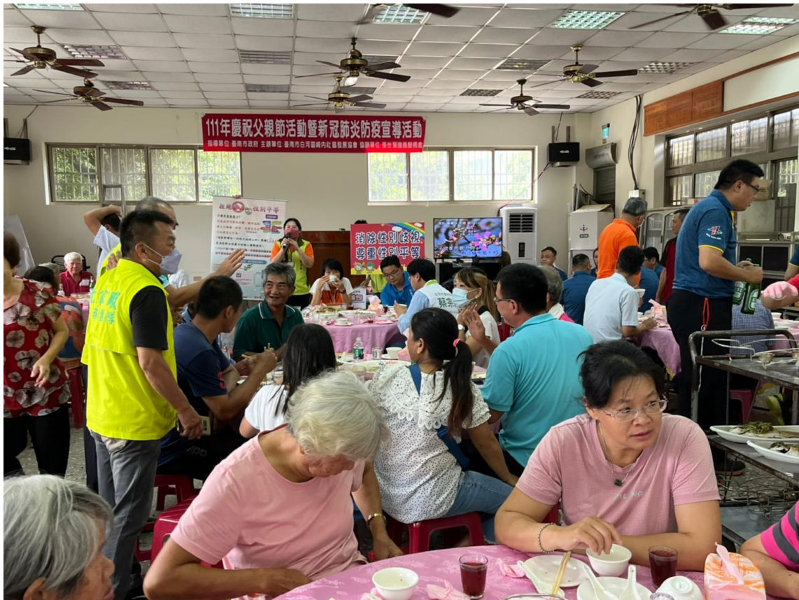
餐敘時間向民眾宣導拒絕暴力尊重性別平等精神