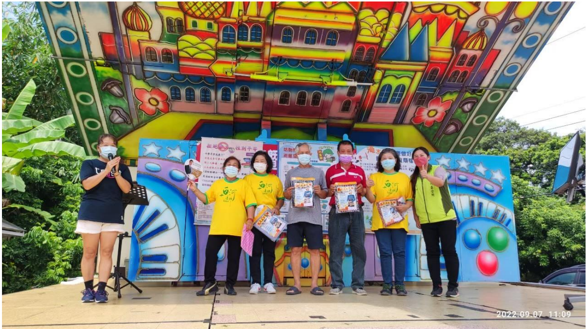
有獎徵答活動頒獎，獲獎民眾樂開懷