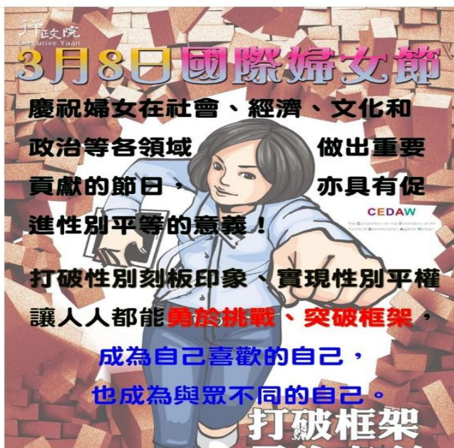
運用本所臉書發布活動訊息

歡慶38國際婦女節 歡迎全家來白河賞花 本所於今(111)年3月5日舉辦「木棉花季系列活動開幕記者會」，木棉花又被叫做是“英雄花”，代表生活的積極向上和蓬勃生機，為慶祝3月8日國際婦女節，將於現場進行促進女性權益與性別平等有獎徵答宣導活動，邀請廣大英雄般的婦女群眾們扶老攜幼全家一起來白河賞花遊玩。 #國際婦女節 #性別平等 #CEDAW