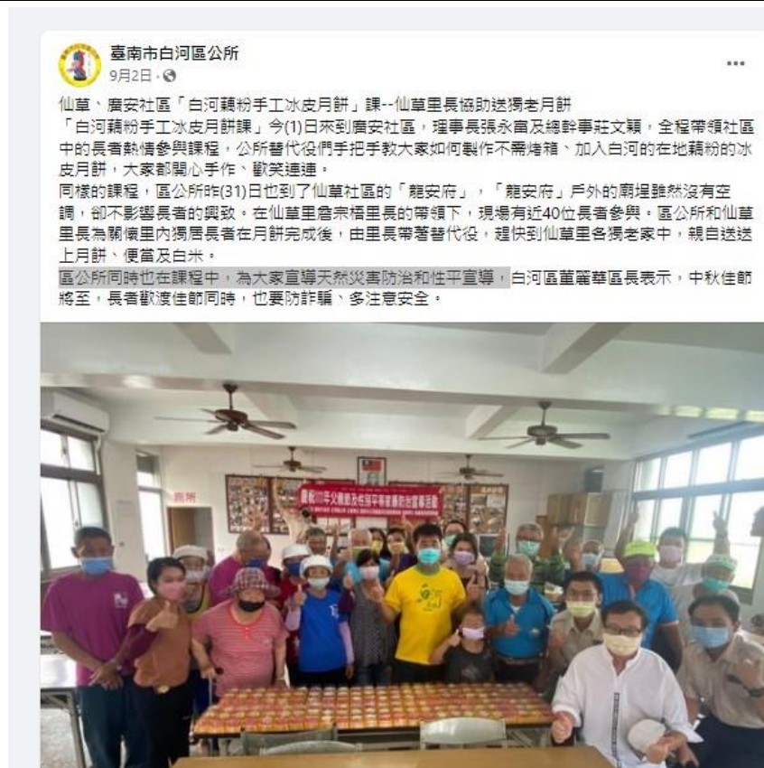
運用本所臉書發布活動訊息