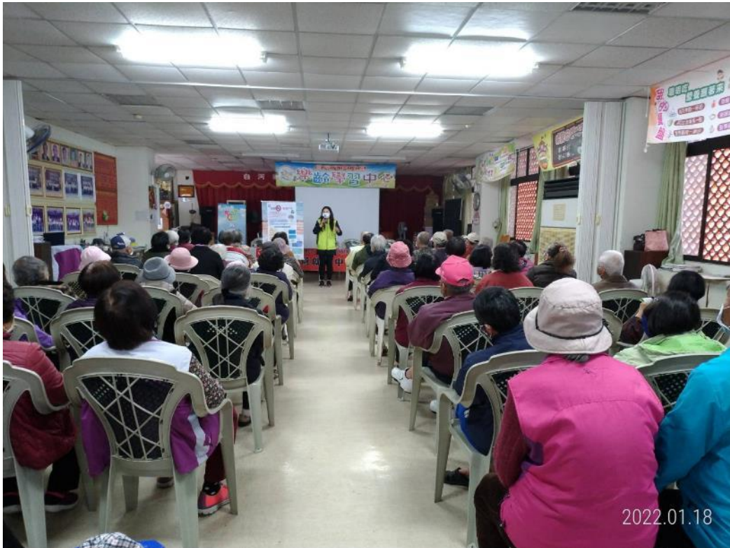
運用自製海報宣導 CEDAW 精神與性別平等概念