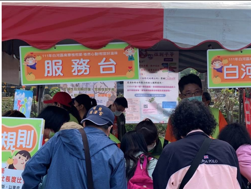
現場懸掛尊重性別平等宣傳布條