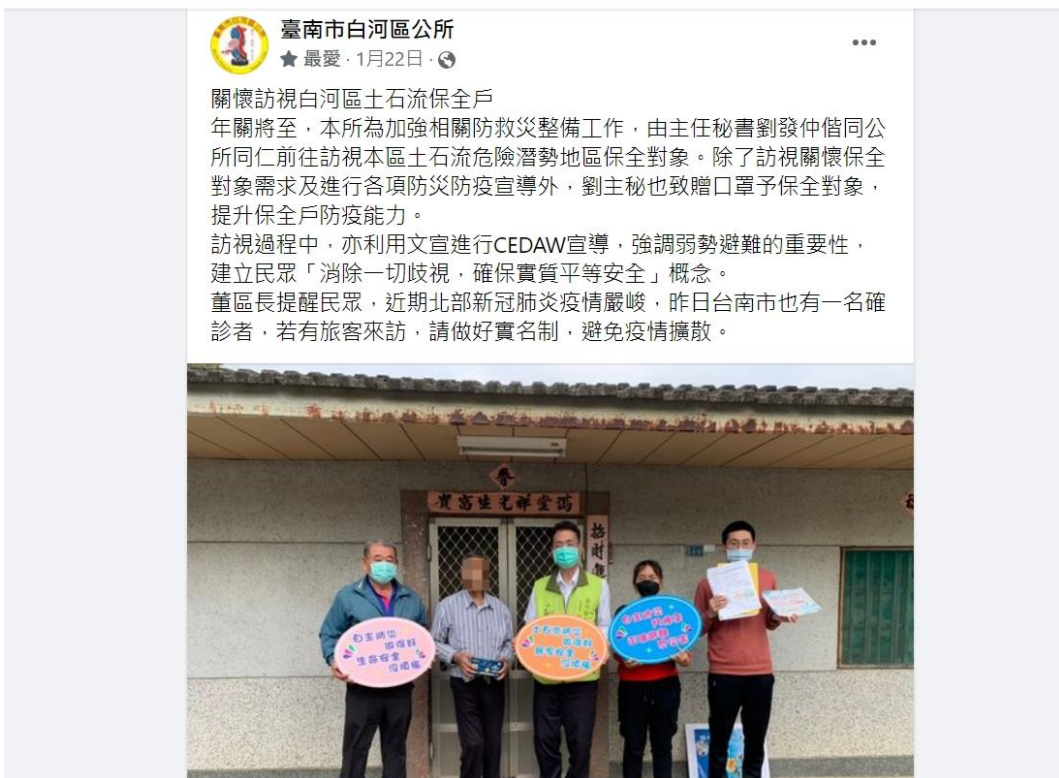
本所 FB 貼文