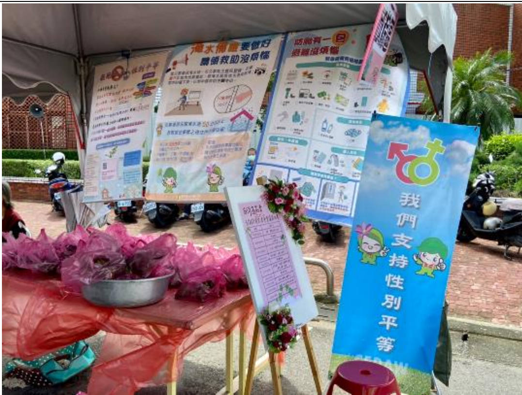
蓮花季行前記者會暨蓮粽比賽現場懸掛宣導海報