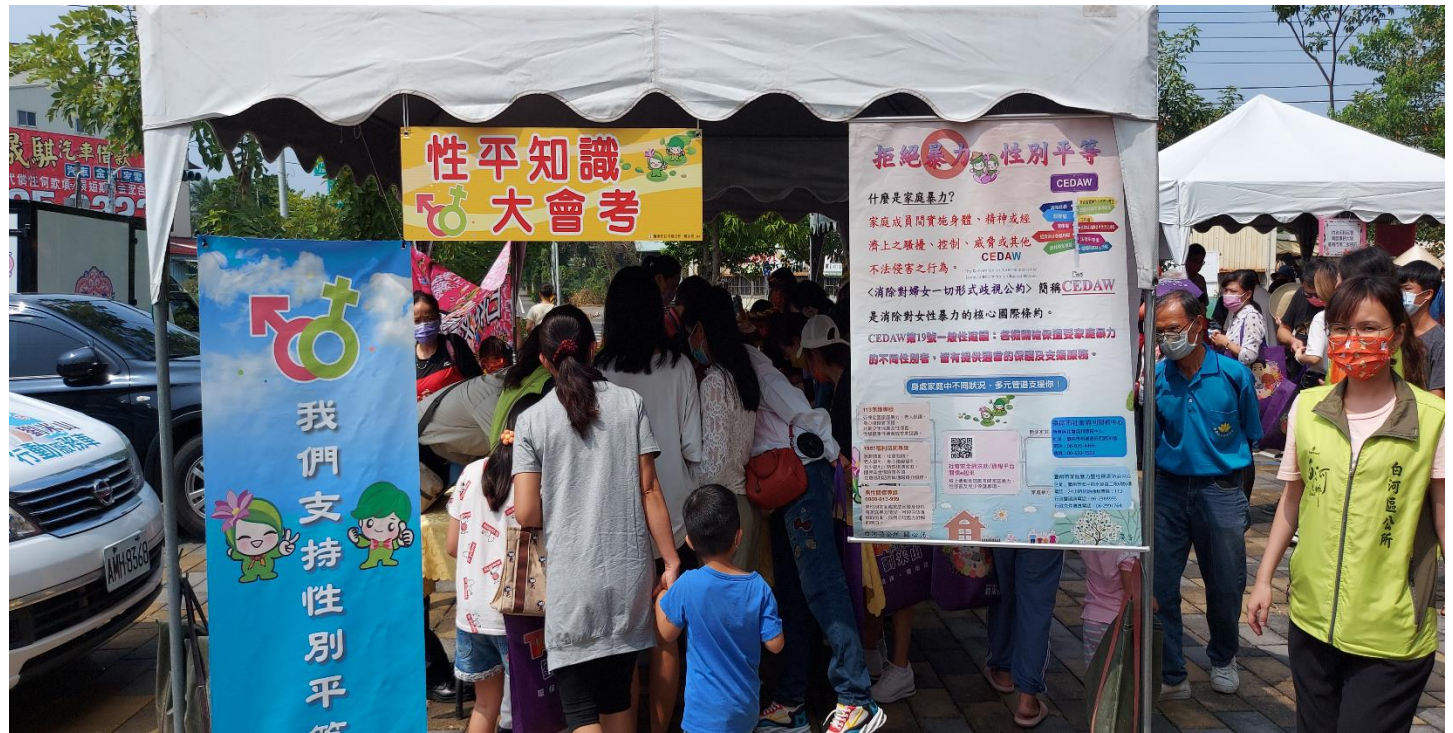
活動設攤向民眾宣導拒絕暴力性別平等精神