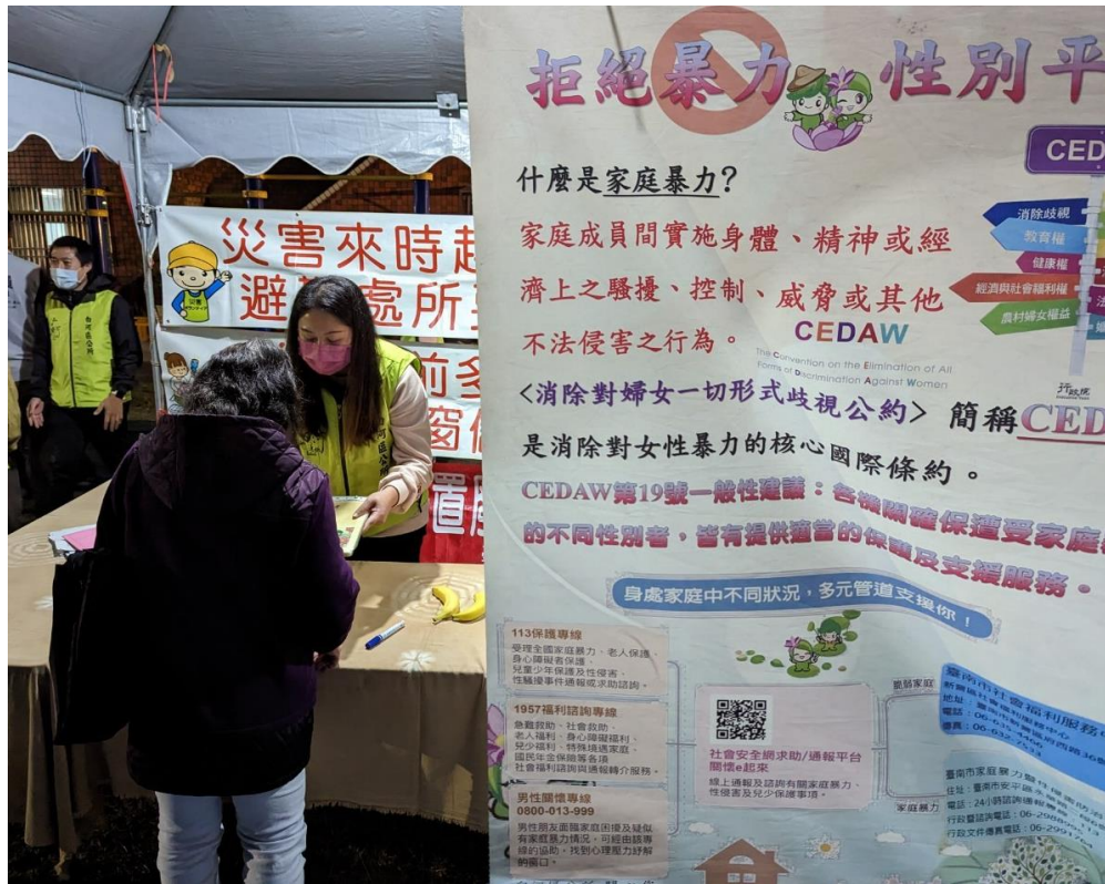
活動設攤向民眾宣導拒絕暴力性別平等精神