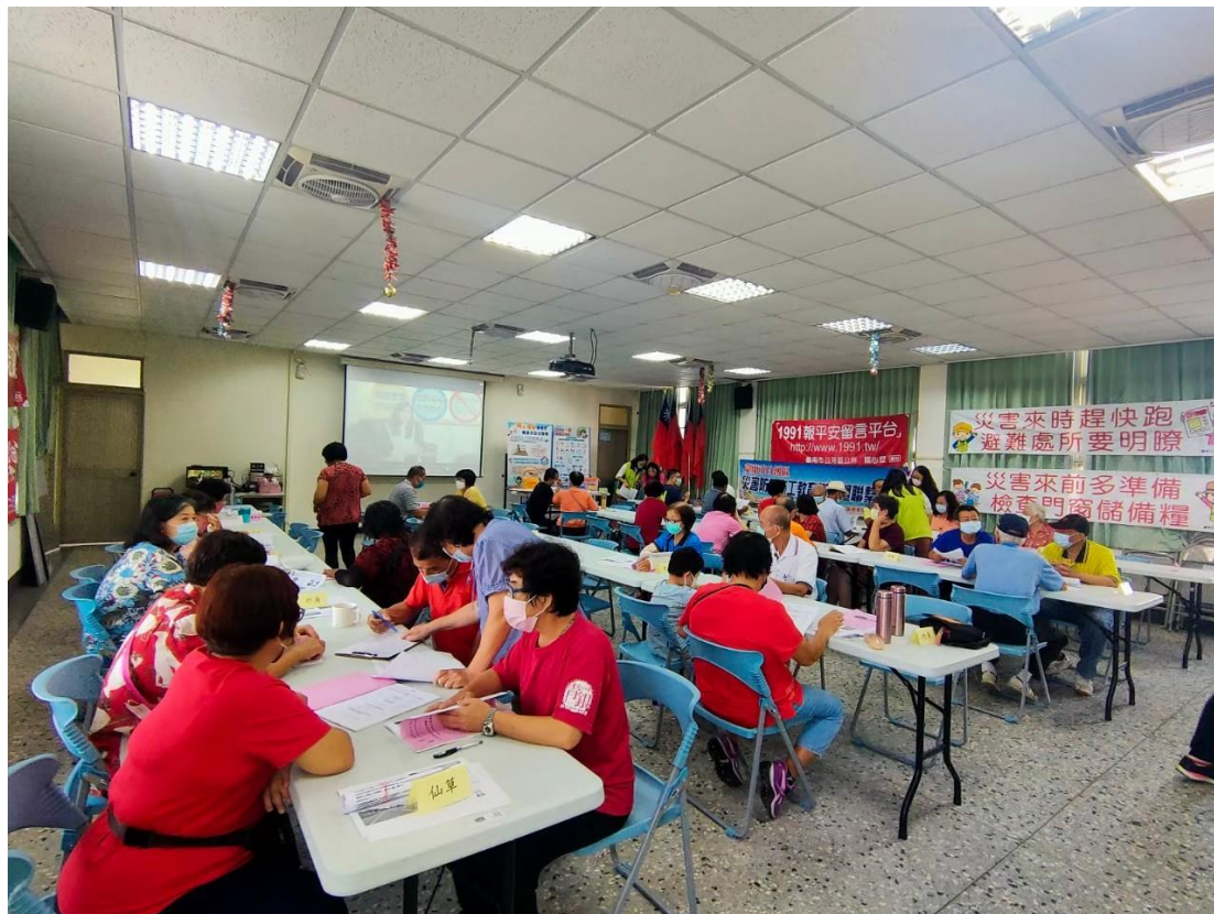
撥放臺南女力「WOMAN' POWER-女力扎根，性平萌芽」宣導影片