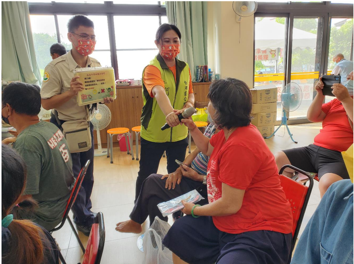
場內進行性平宣導及有獎徵答活動