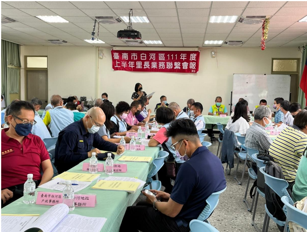
區長進行 CEDAW 宣導