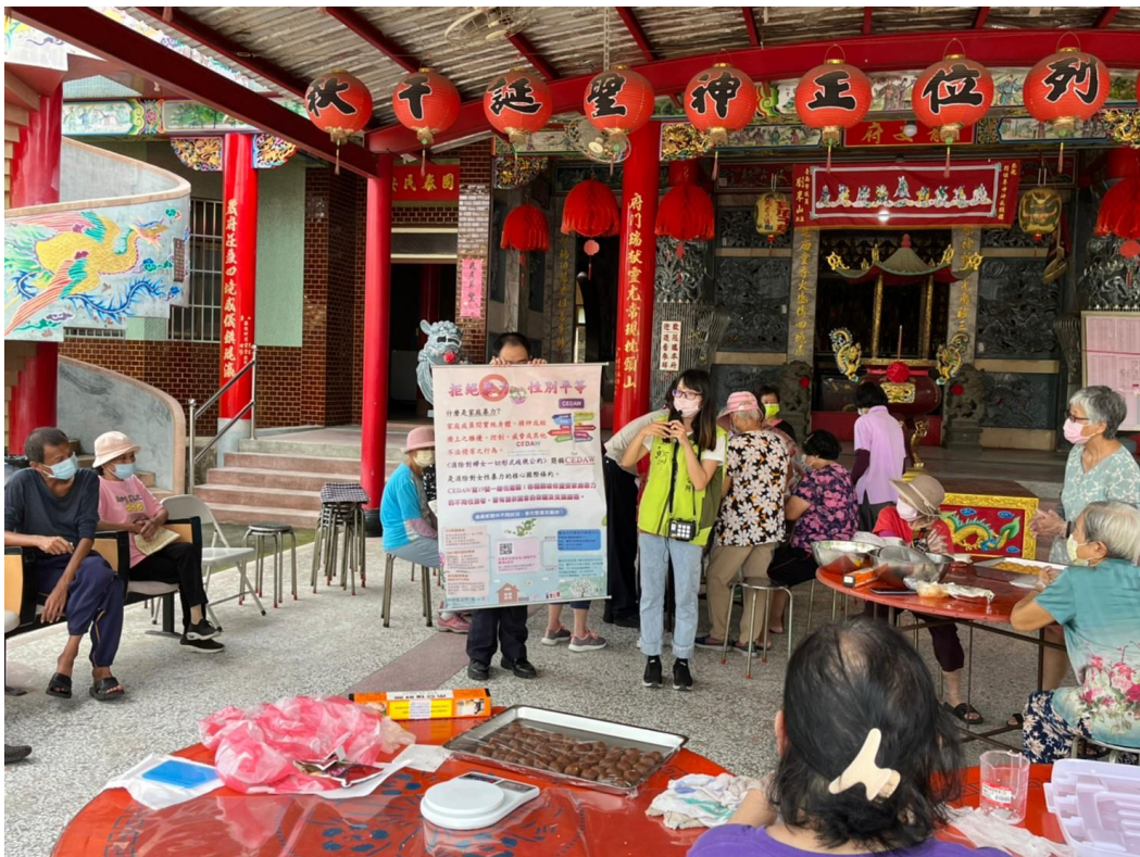
仙草社區性平宣導