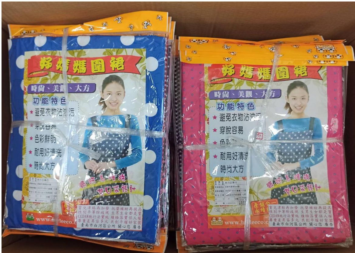
宣導品為圍裙，用意為提醒民眾共同分擔家務