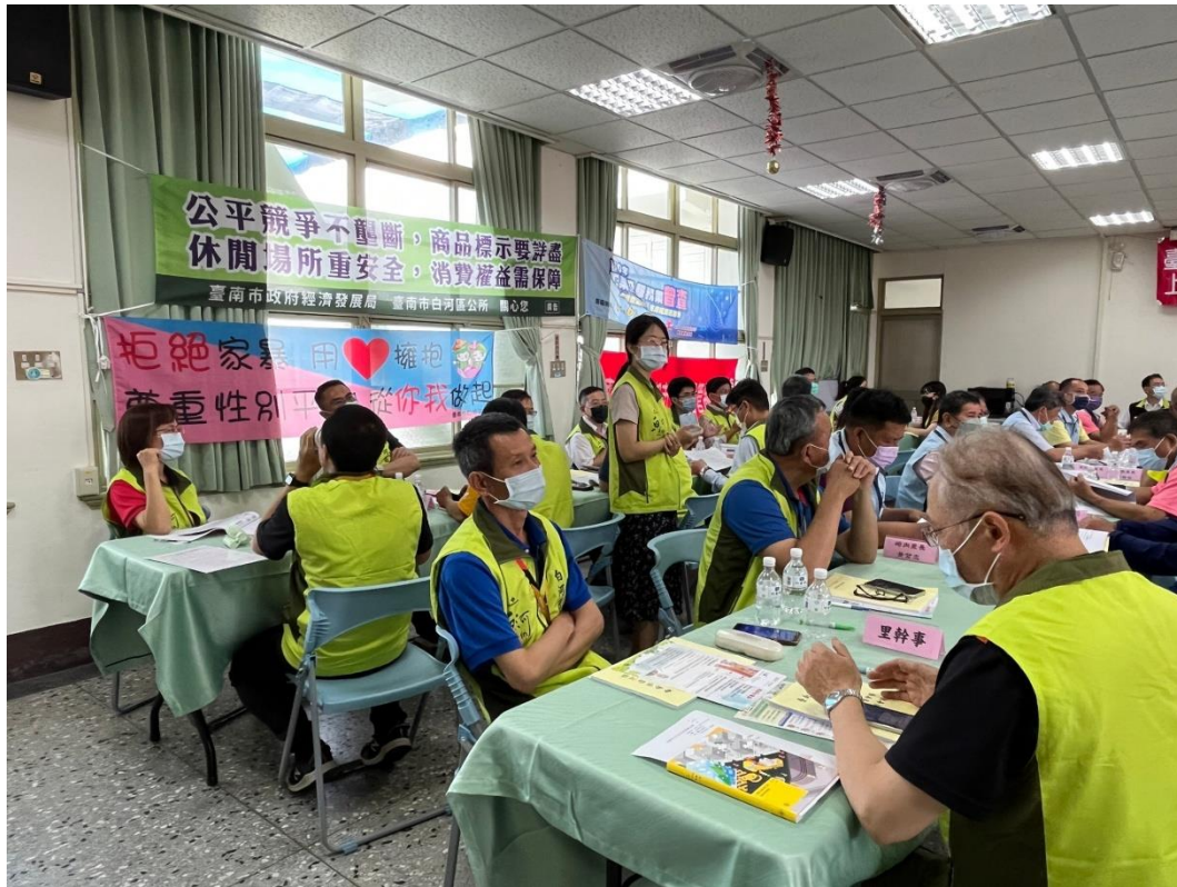
現場懸掛拒絕家暴，尊重性別平等布條