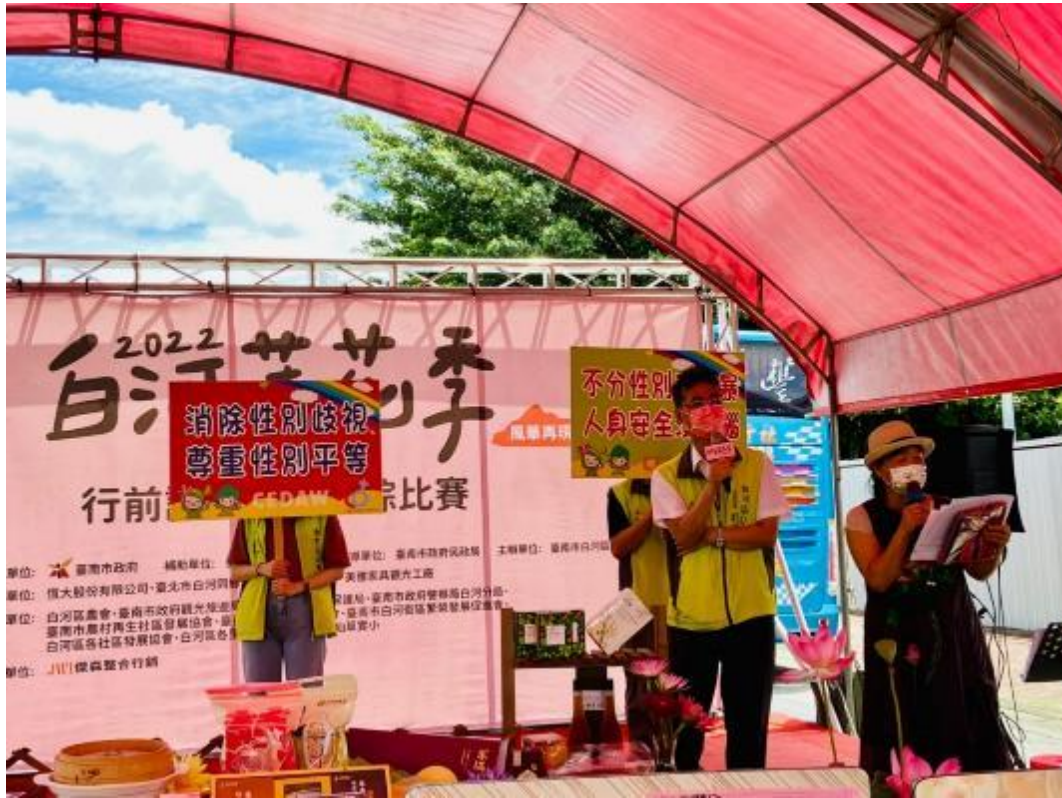
蓮花季行前記者會暨蓮粽比賽向民眾宣導拒絕暴力性別平等精神