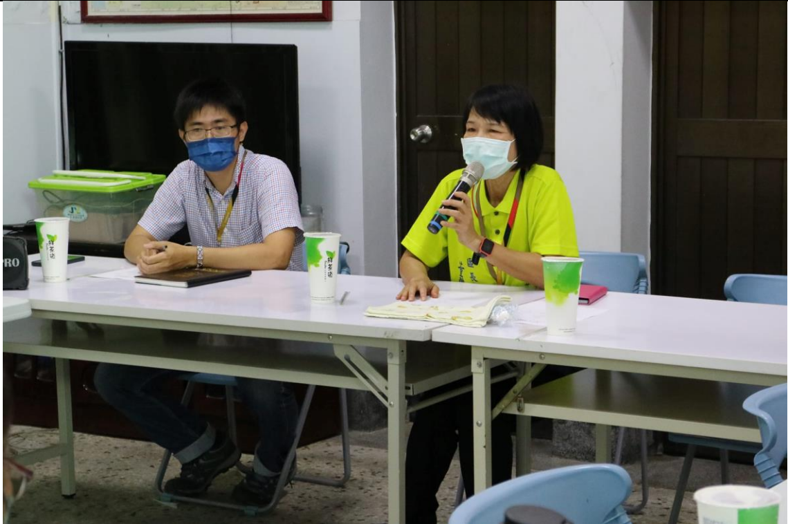
董區長主持志工聯繫會報