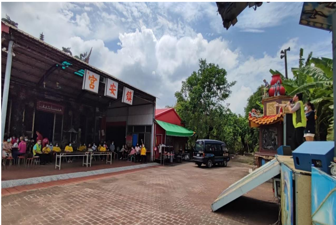
活動現場進行宣導