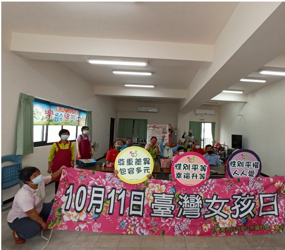
永安社區性平宣導合照