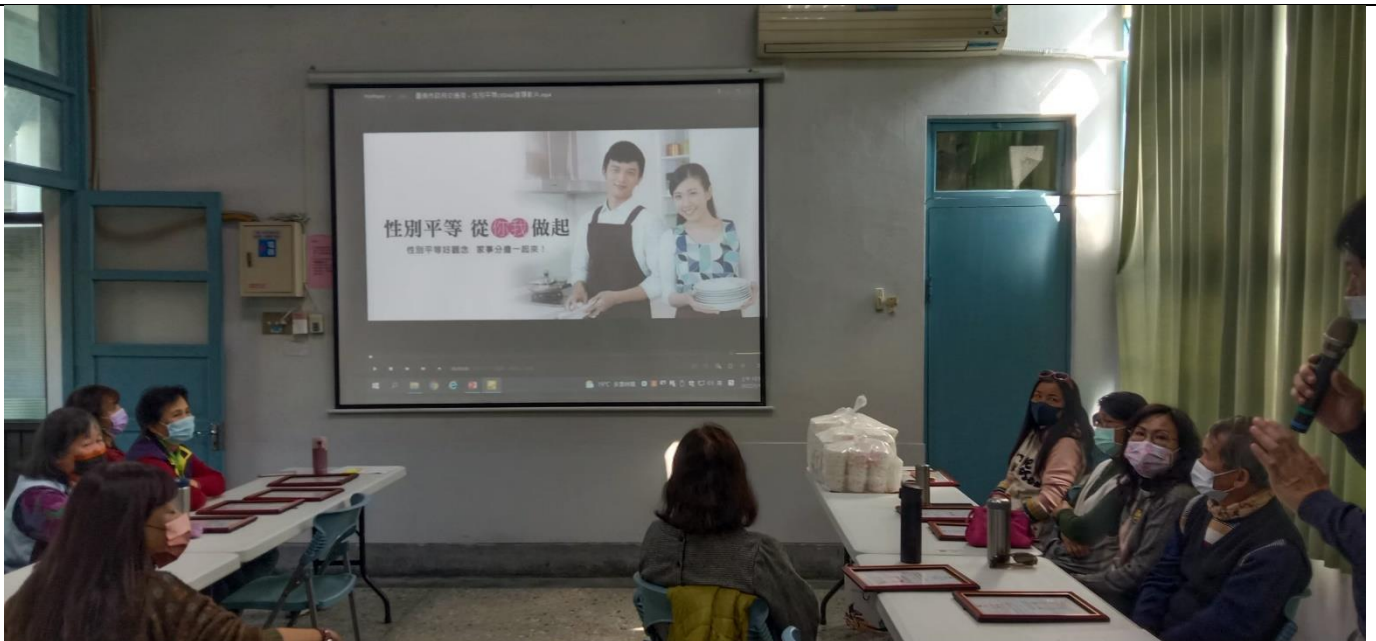
性別平等-家事分擔一起來