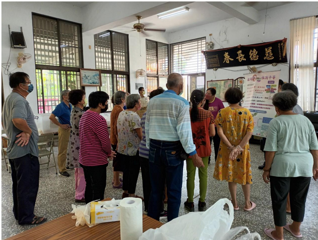
甘宅社區性平宣導