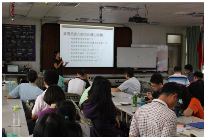
講授內容精彩豐富