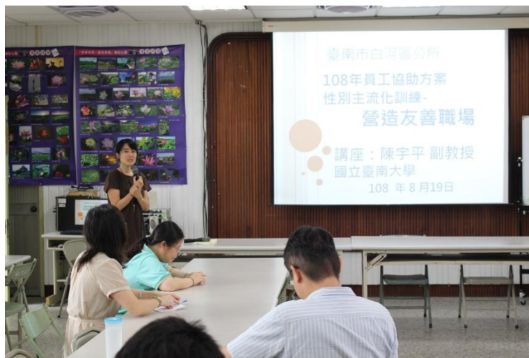
營造性別友善職場講座