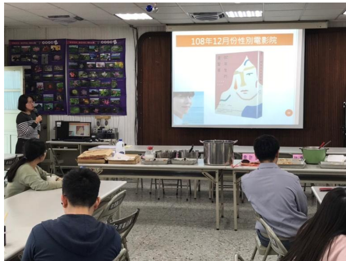
108年12月份性別電影院