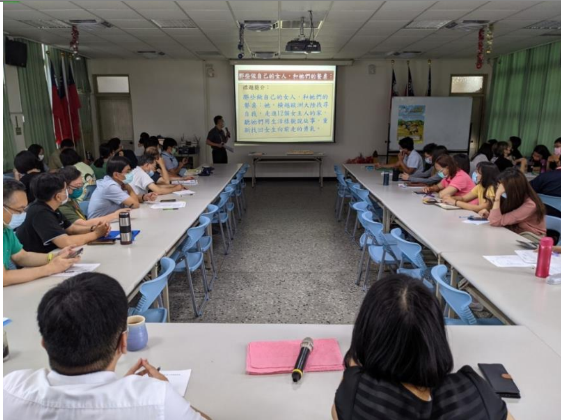
辦理性平讀書會導讀情形。