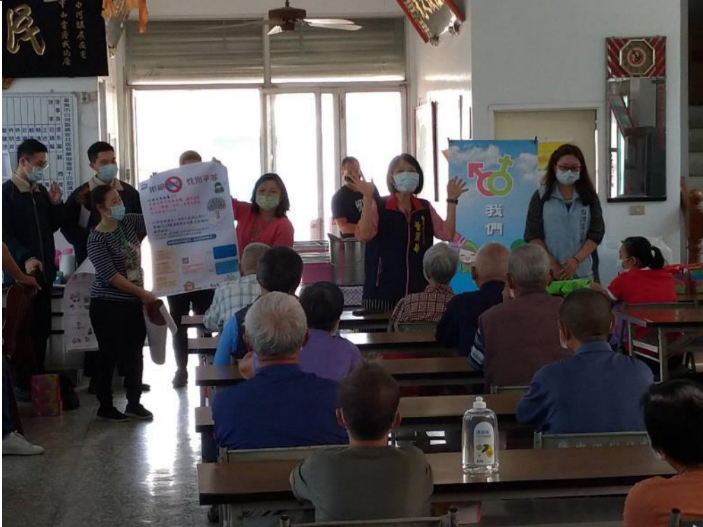
3/17 廣安呷飯廳由董區長帶隊進行宣導