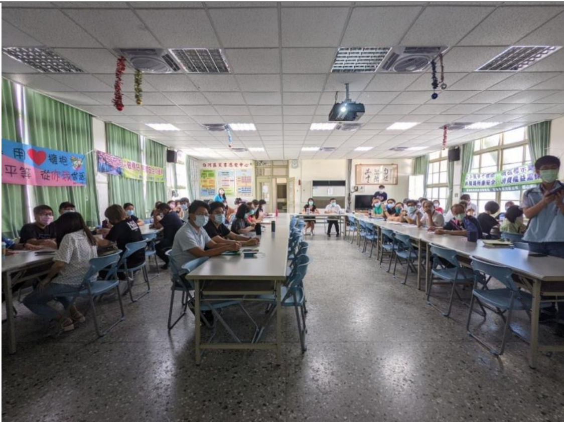
全體同仁參與讀書會情形。