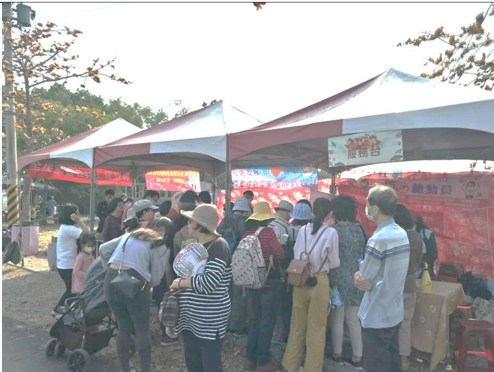
民眾熱情參與有獎徵答活動