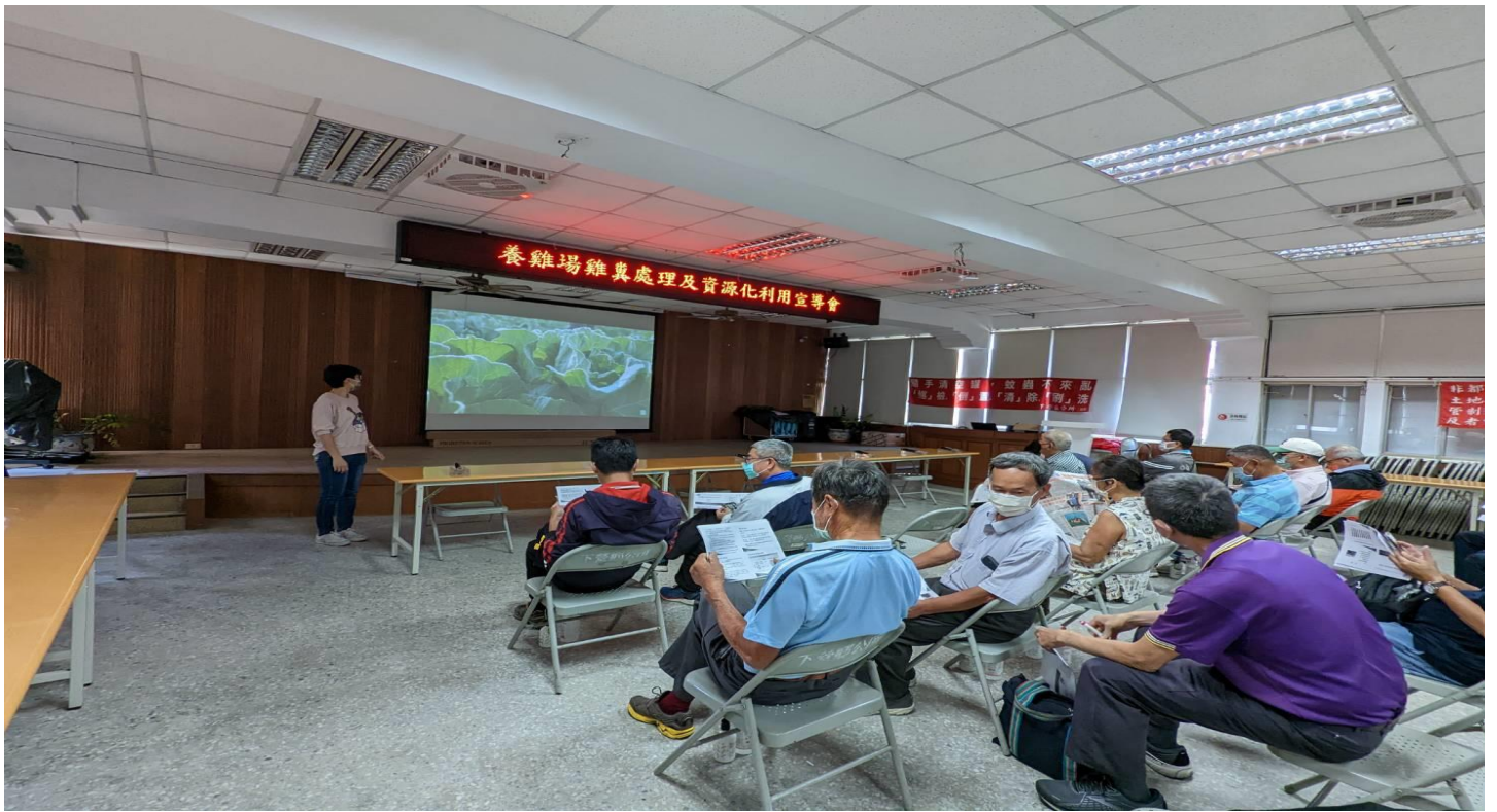
照片說明(向與會人員宣導何謂 CEDAW)