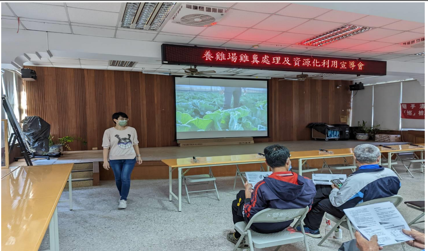
照片說明(播放南農女力宣導影片給與會人員)