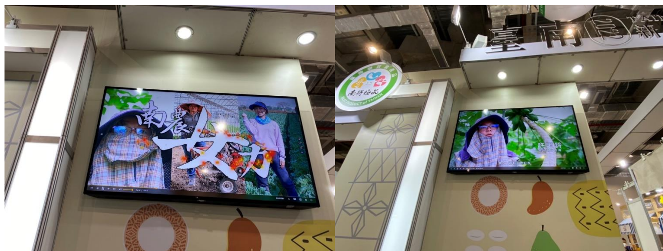
台北國際食品展-本市南得極品館-「南農女力」影片輪播