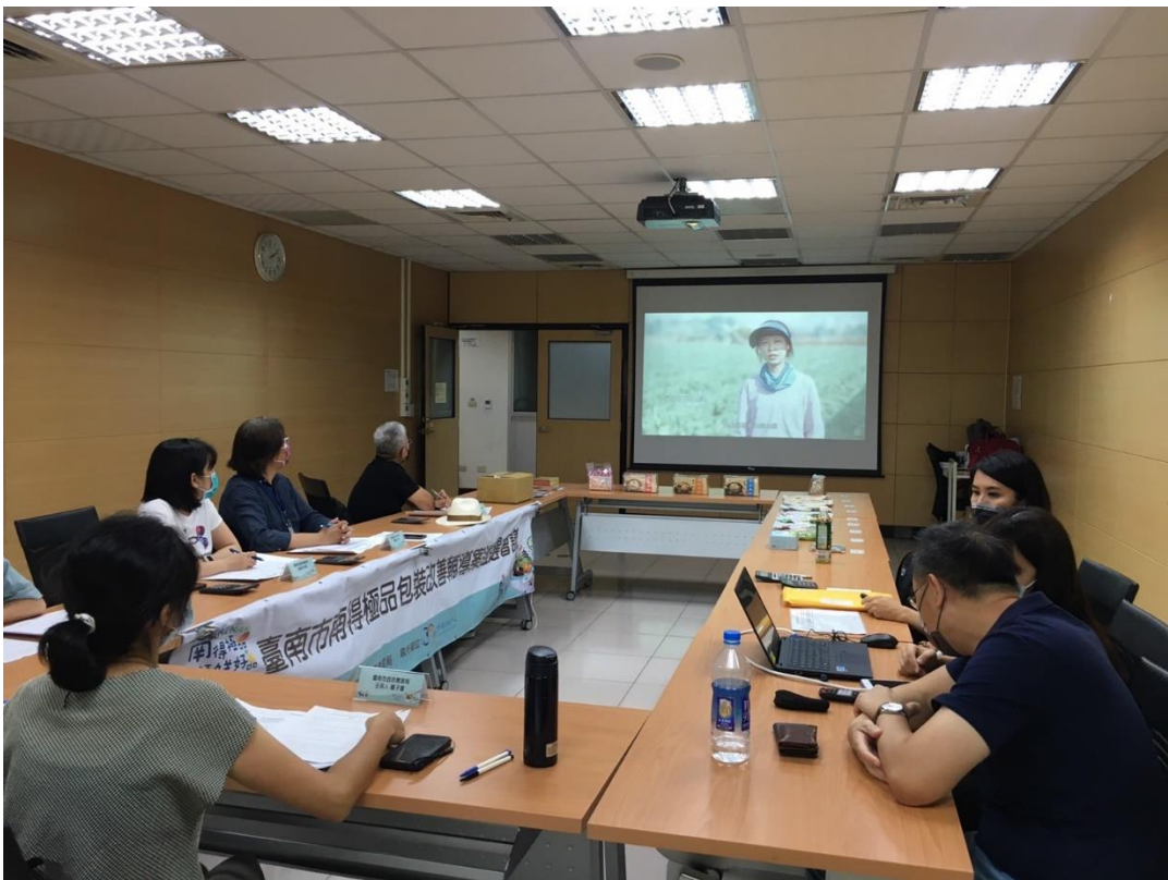
臺南市南得極品包裝改善輔導案遴選會議開始前播放影片