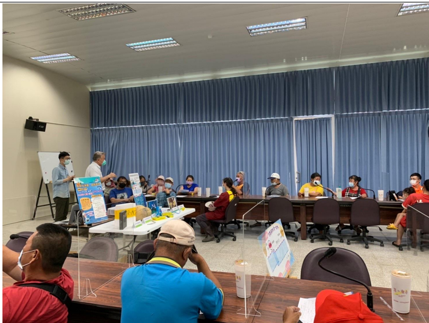
111年4月28日將軍漁港直銷中心