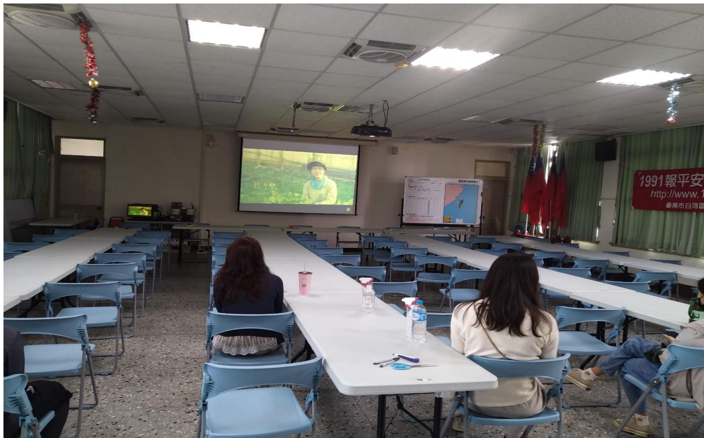
照片說明(播放南農女力宣導影片給與會人員)