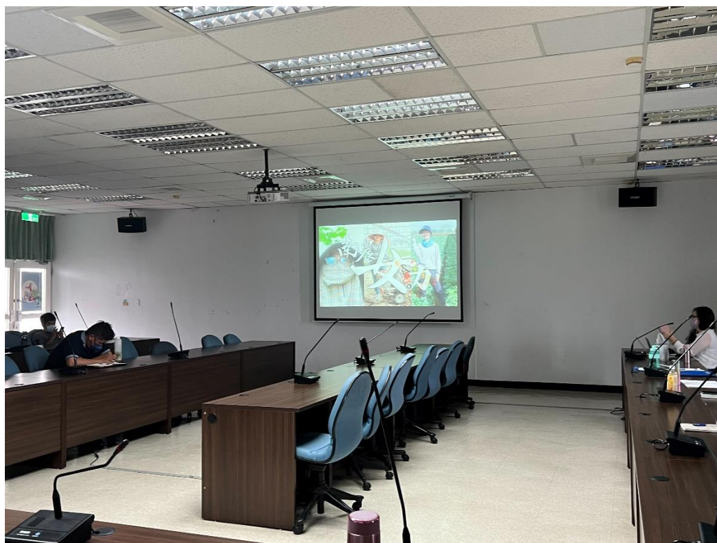
透過影片宣導職業不分性別