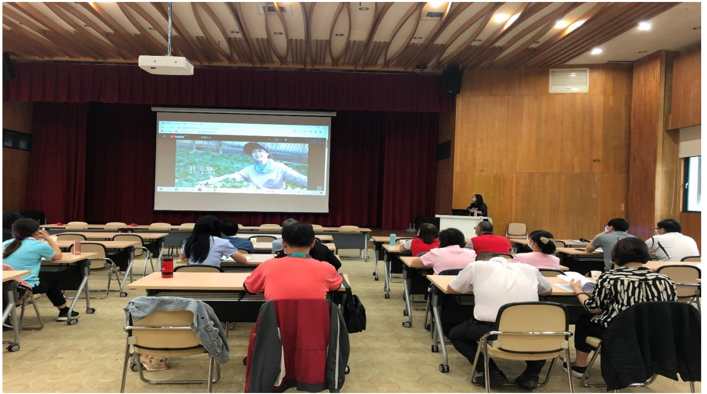
照片說明(向與會人員宣導何謂 CEDAW)