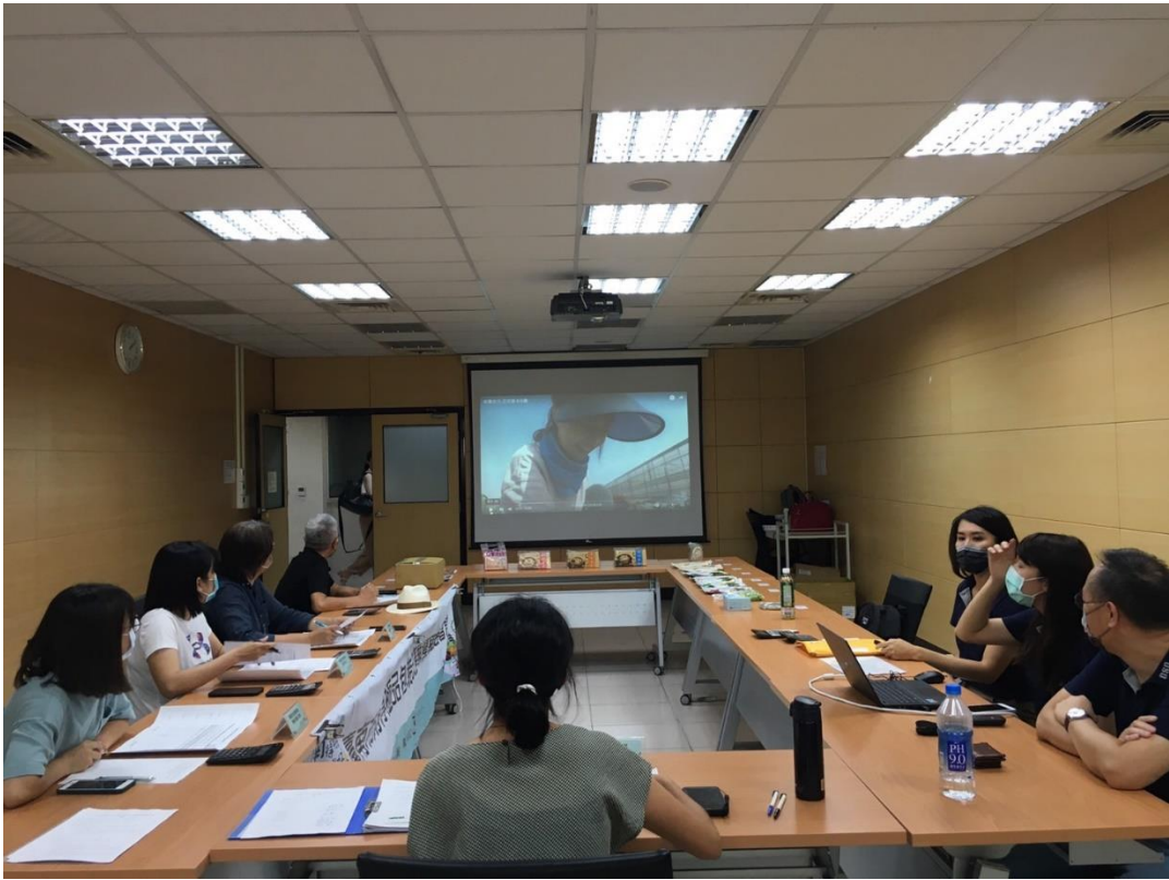
臺南市南得極品包裝改善輔導案遴選會議開始前播放影片