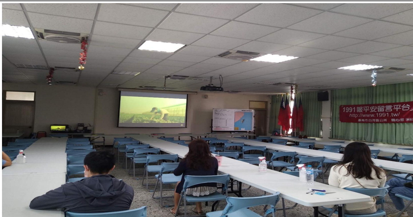
照片說明(播放南農女力宣導影片給與會人員)