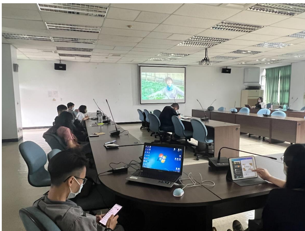
即使男女體力有別，但女性仍善用其特長為農業上闖出一片天。