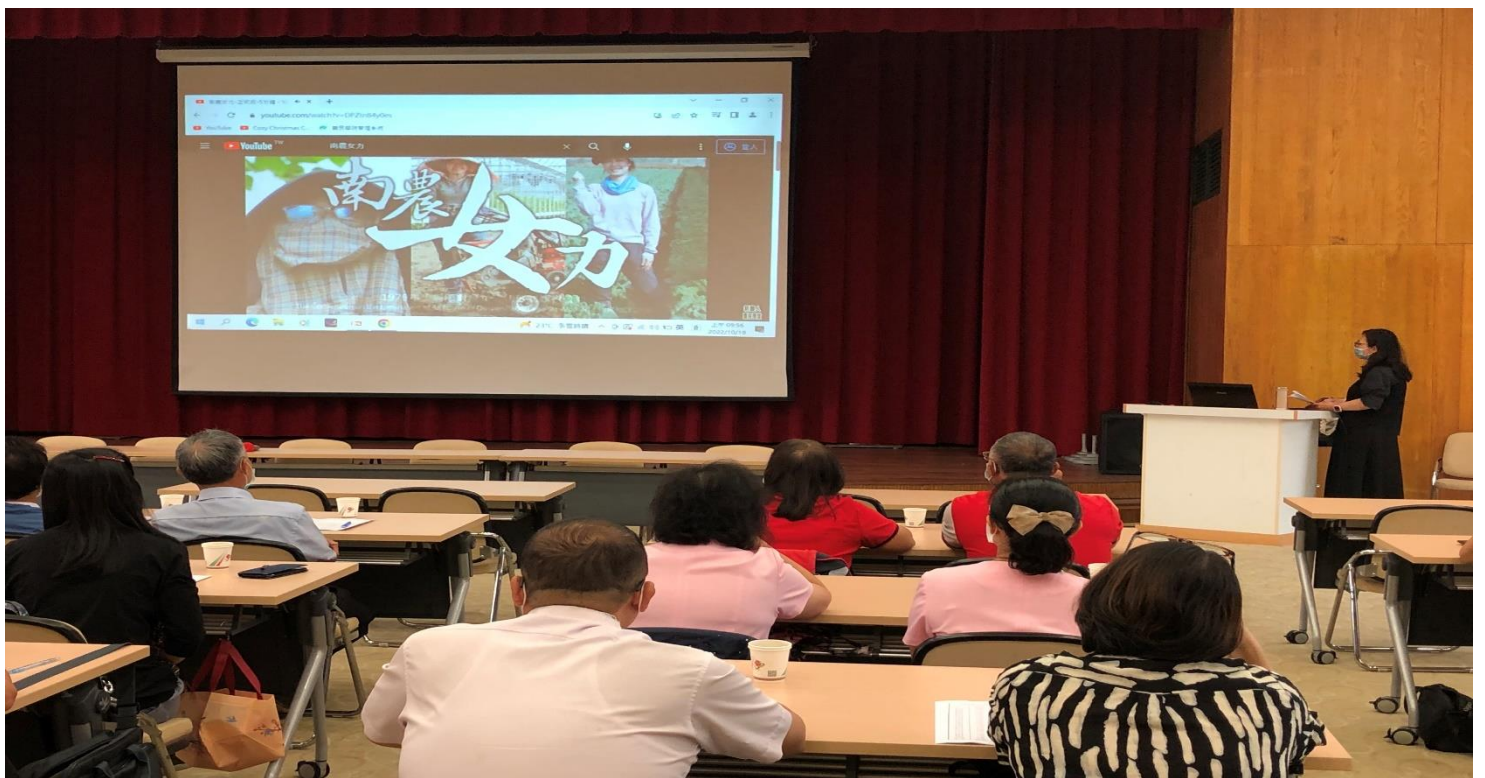
照片說明(播放南農女力宣導影片給與會人員)