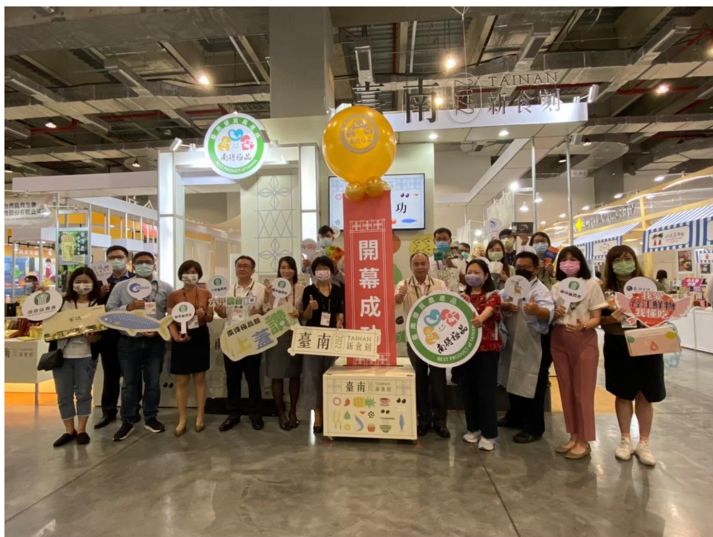
台北國際食品展-本市南得極品館-「南農女力」影片輪播