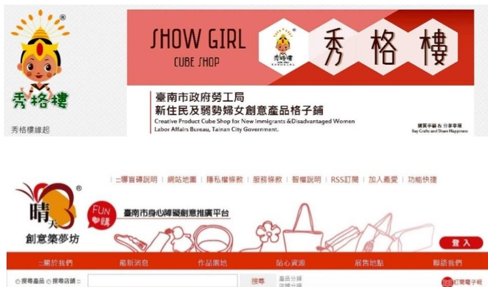
圖 2：秀格樓及晴天坊網站

因此，臺南市政府勞工局認為對經濟弱勢勞工的就業服務，給魚不如給技能的釣竿，給釣竿更要給豐沛的就業漁場。於是便思考除了協助經濟弱勢勞工就業外，對於部分可能因為生理、心理、家庭照顧等各種因素無法進入一般職場的身心障礙者、新住民、中高齡等特定對象婦女等，更建立其他的就業模式，增加經濟收入，同時也能讓他們的一技之長在一般職場以外發光發熱。因此，自 101 年開始規劃建置「晴天創意築夢坊」網路展售平台及「秀格樓」格子鋪實體展售據點計畫(如圖 2)，提供漁場給身心障礙者、弱勢婦女展售創作品，增加收入改善生活，並能兼顧照顧家庭的需求。