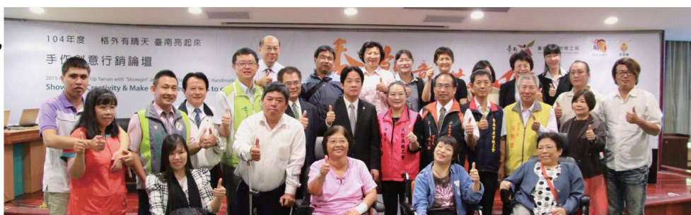
圖 6：格外有晴天 臺南亮起來」手作創意行銷論壇