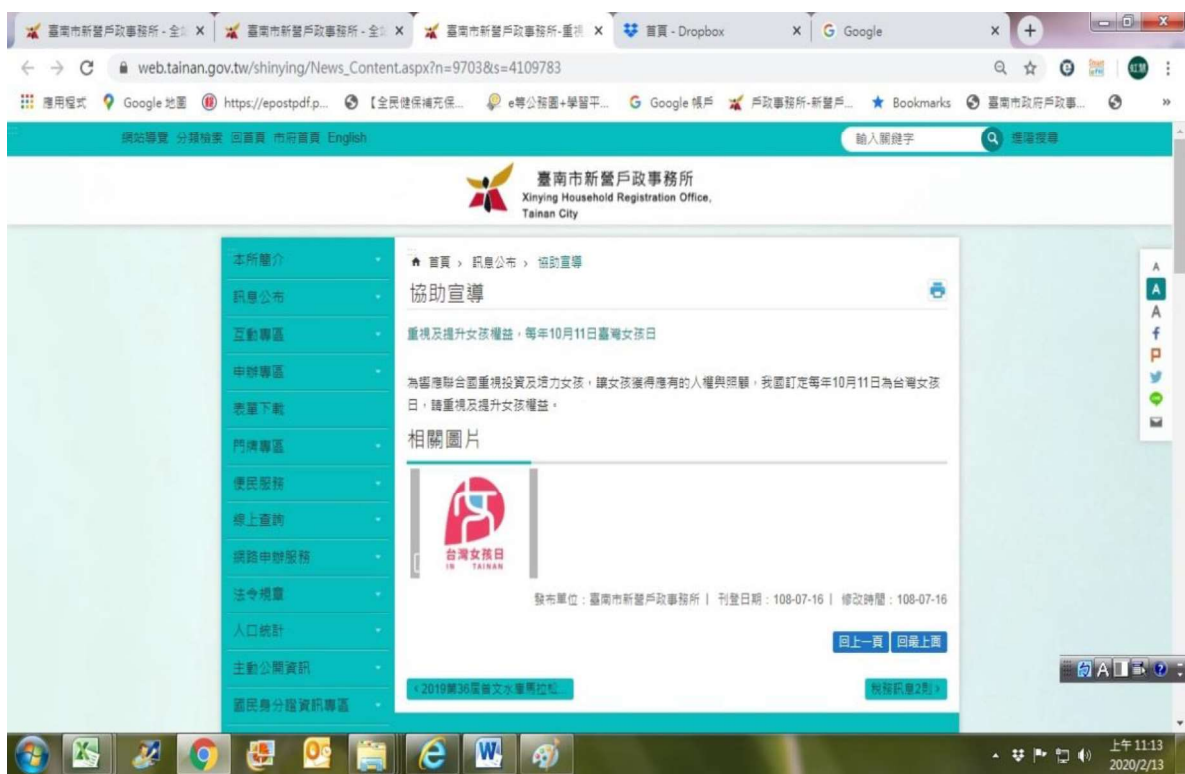
台灣女孩日網站宣導