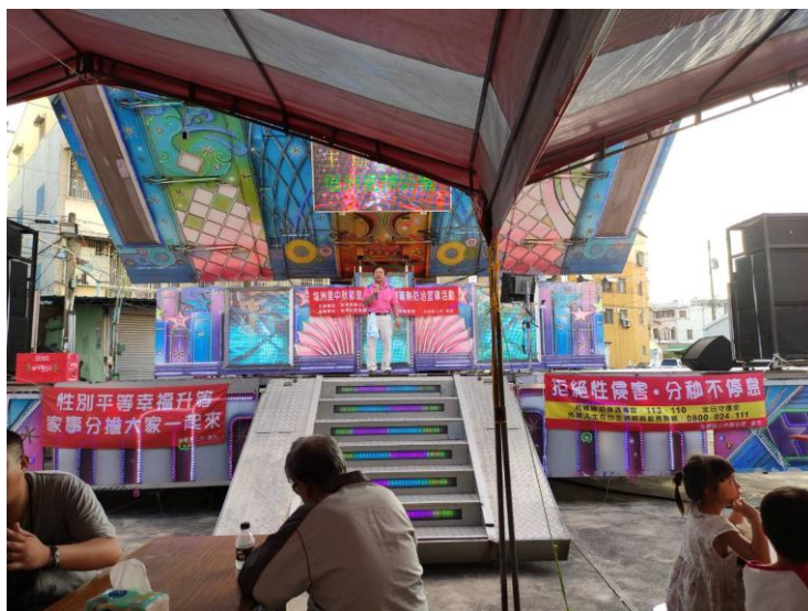
照片說明:配合里民中秋節聯歡暨登革熱政令宣導活動，宣導性別平等