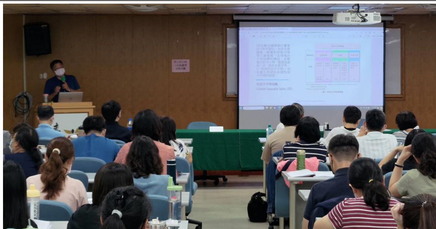
照片說明：性別不平等指數架構