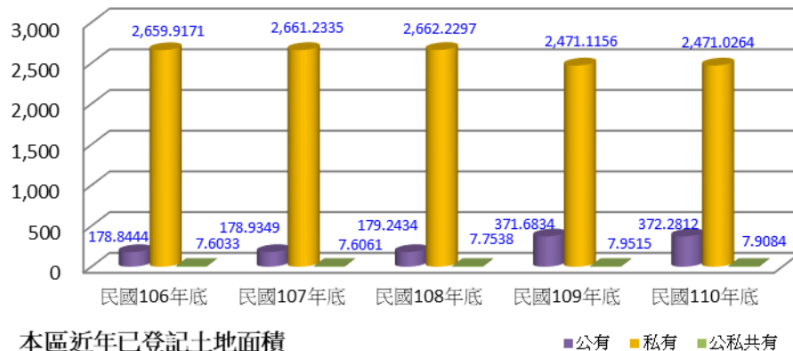
本區近年已登記土地面積 依土地權屬別分