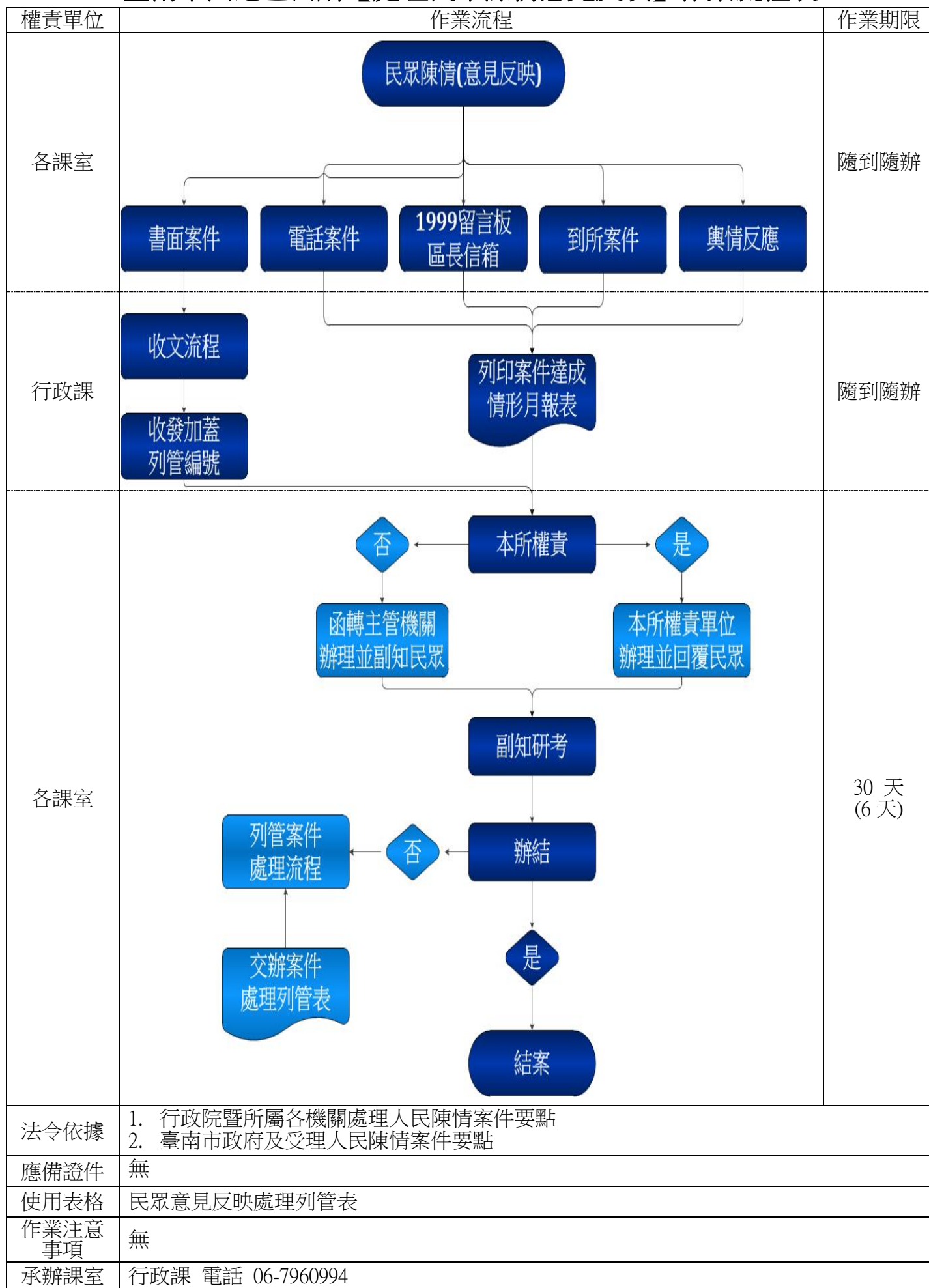
臺南市西港區公所【處理民眾陳情意見反映】作業流程表