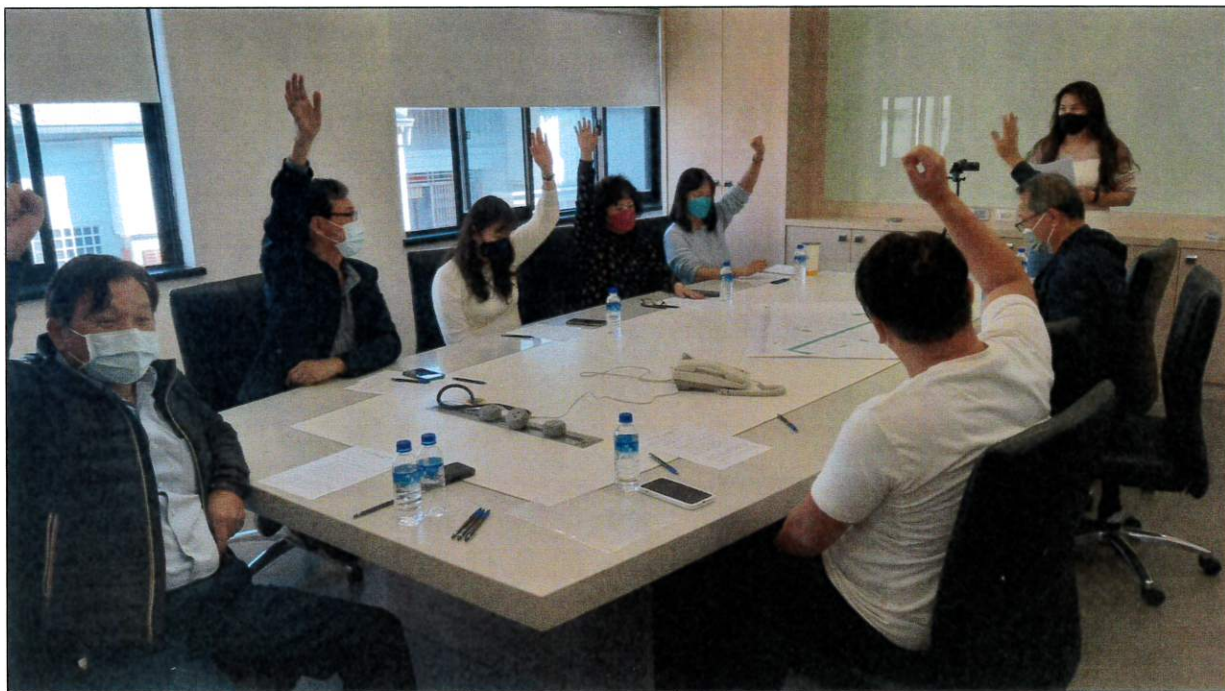
臺南市第 135 期草湖(一)自辦市地重劃區第三十次理事會照片