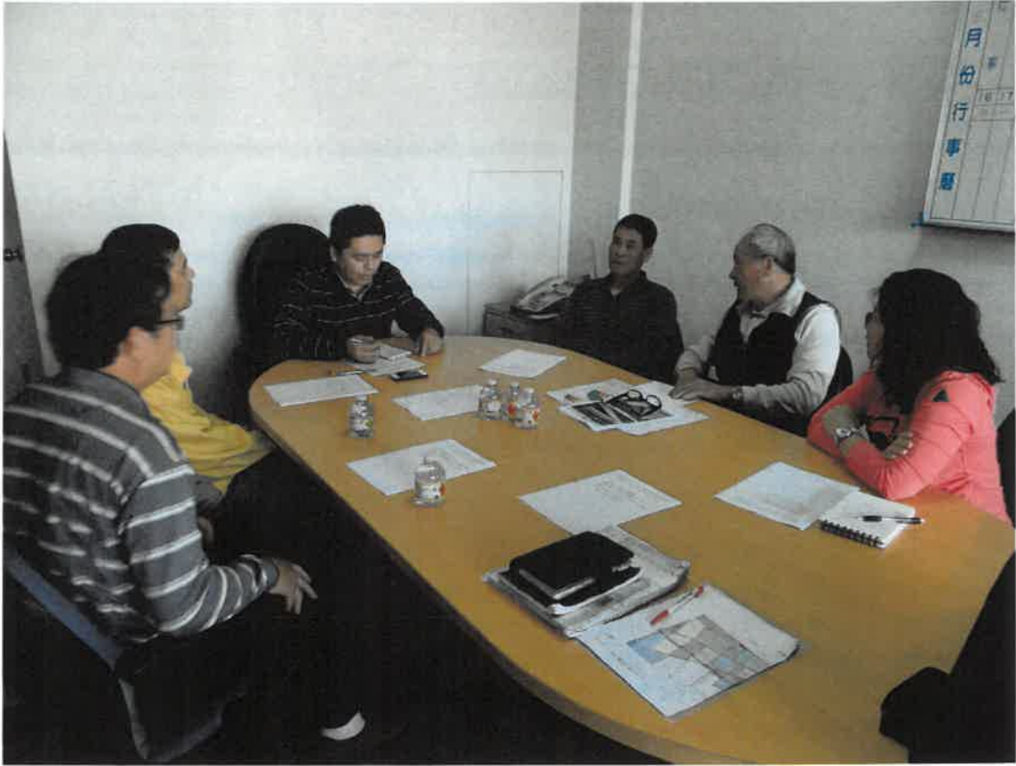
(攝 103 年 03 月 13 日會議過程)