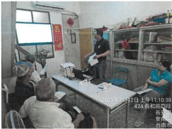
2023年11月2日 上午11:10:38 424 長和路四段 長安里 安南區 台南市