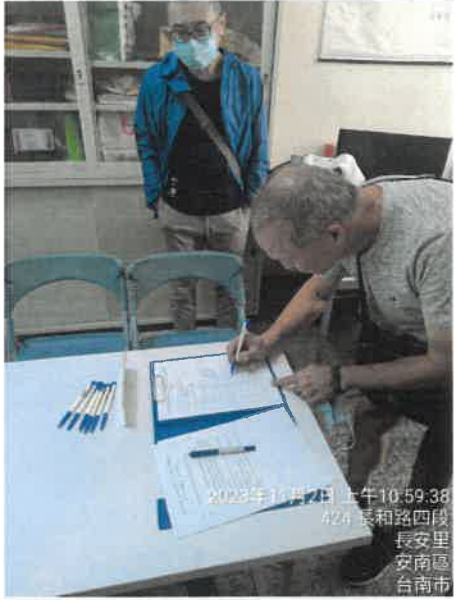
2023年11月2日 上午10:59:38 424 長和路四段 長安里 安南區 台南市