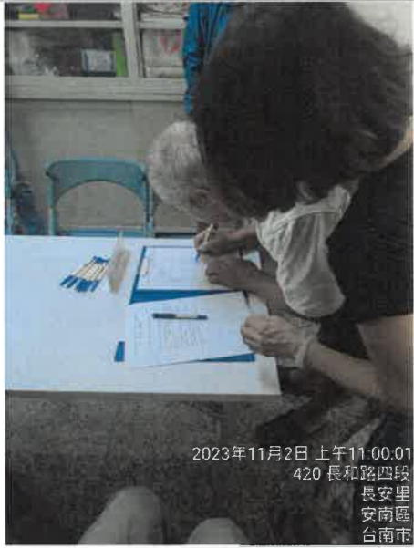
2023年11月2日 上午11:00:01 420 長和路四段 長安里 安南區 台南市