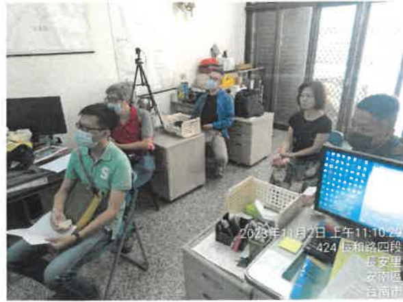
2023年11月2日 上午11:10:24 424 長和路四段 長安里 安南區 台南市