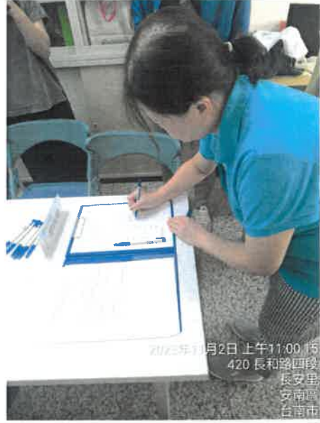
2023年11月2日 上午11:00:15 420 長和路四段 長安里 安南區 台南市