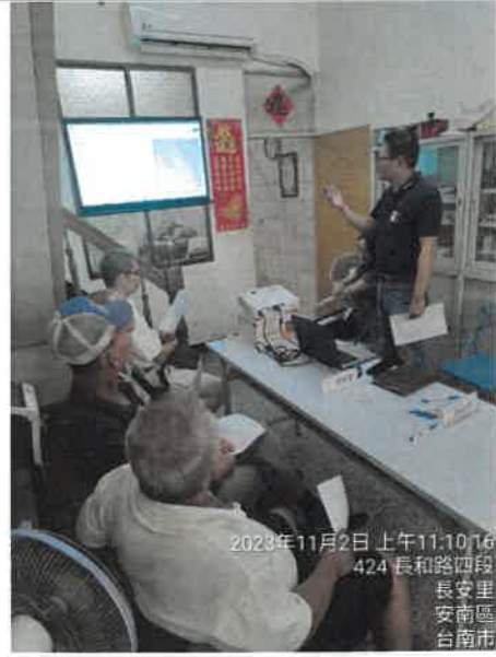
2023年11月2日 上午11:10:16 424 長和路四段 長安里 安南區 台南市