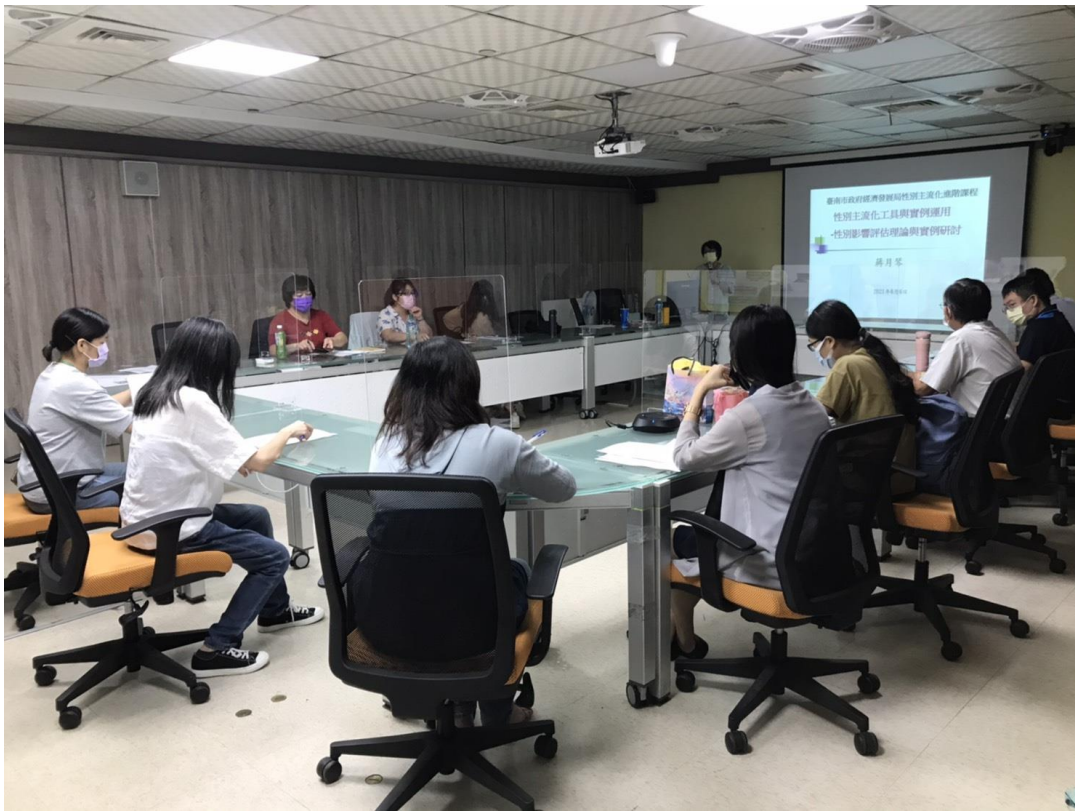
講師簡單自我介紹並講解性別主流化工具之一-性別影響評估之目的及內涵