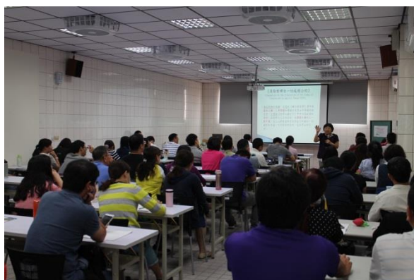
講授 CEDAW 內涵