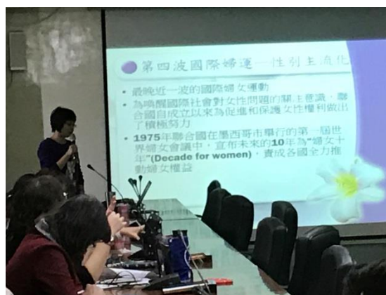
講授 CEDAW 內涵