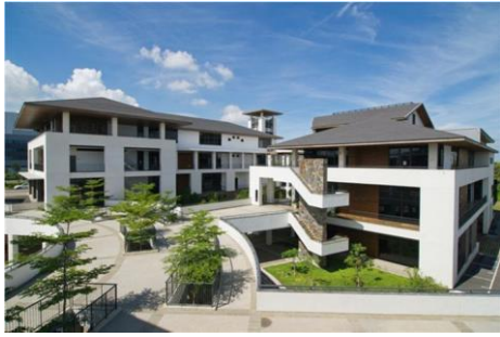
樹谷園區服務中心