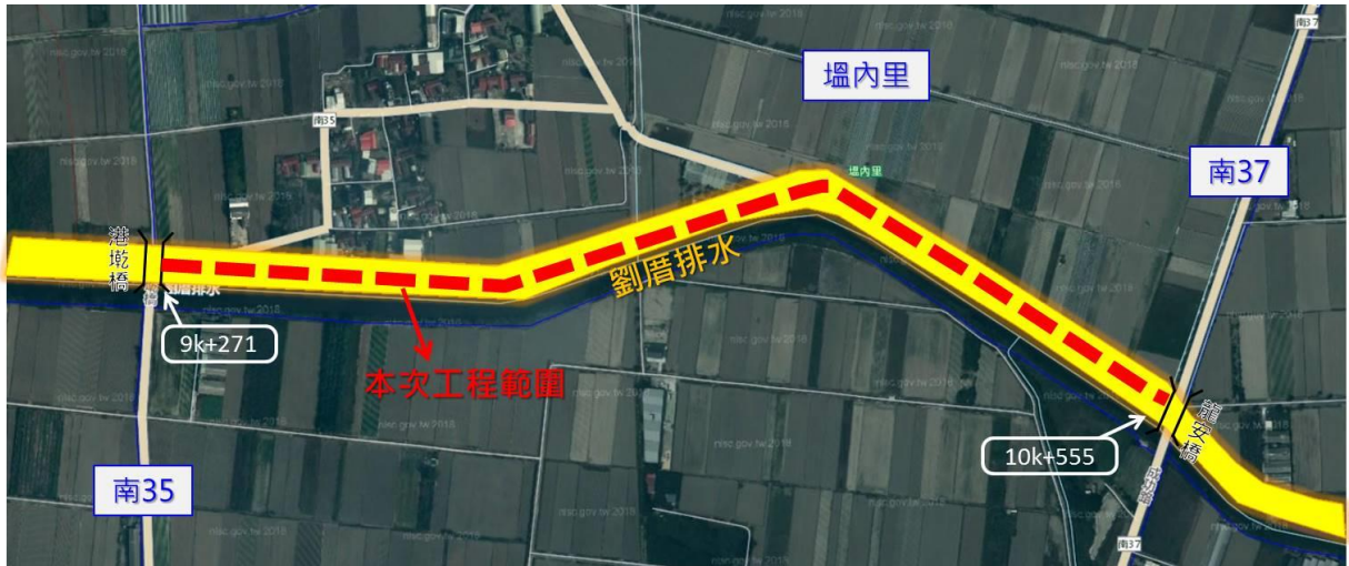
圖 1 本計畫區位示意圖

「劉厝排水治理工程(9k+271~)」位於本市佳里區塭內里，西起南 35 區道港墘橋，東至南 37 區道龍安橋，南、北側用地範圍內使用地類別為交通用地、農牧用地、特定目的事業用地及水利用地，全長約 1,284 公尺，面積約 6.3312 公頃，計畫區位如下圖所示。