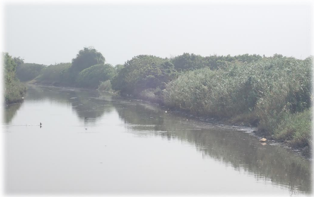
圖 3 現況示意圖