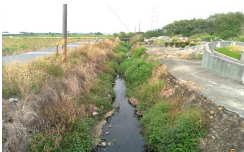
圖 3 用地現況圖