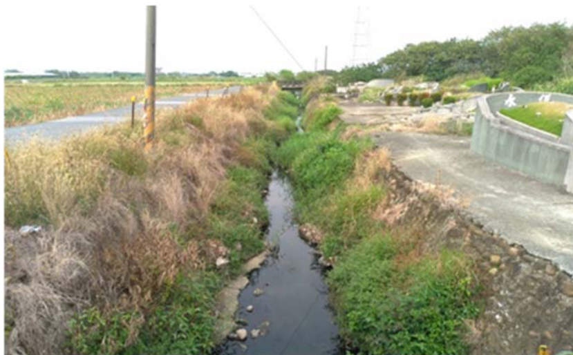
圖 3 用地現況圖