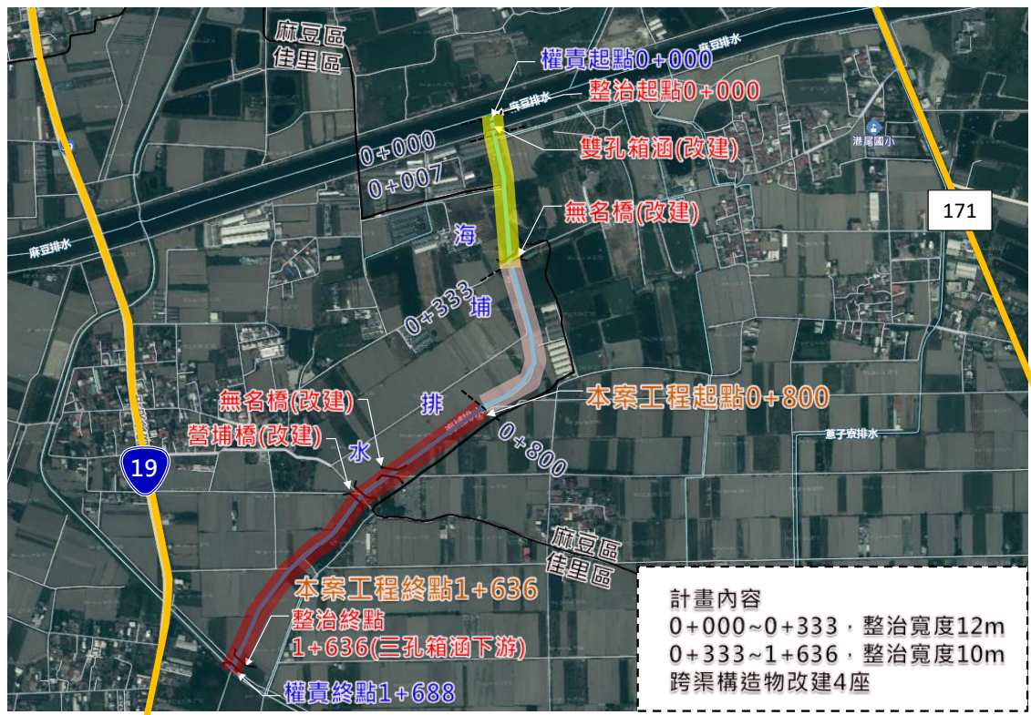
圖 1 本計畫區位示意圖

地及水利用地，全長 1,636 公尺，本次取得長度 836 公尺，預計徵收面積為 1.4055 公頃。