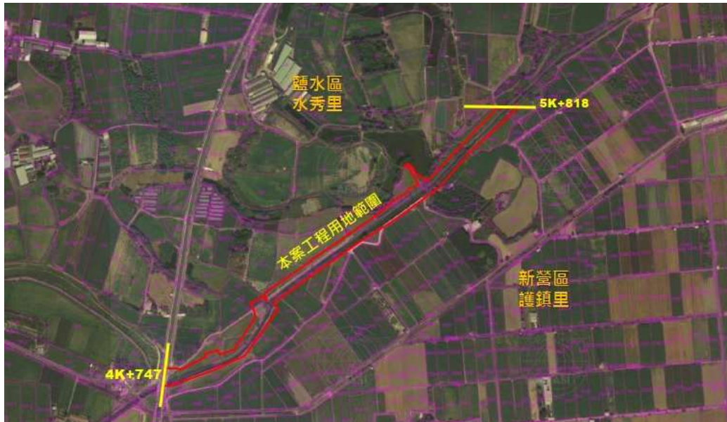
圖 1 本案計畫區位圖