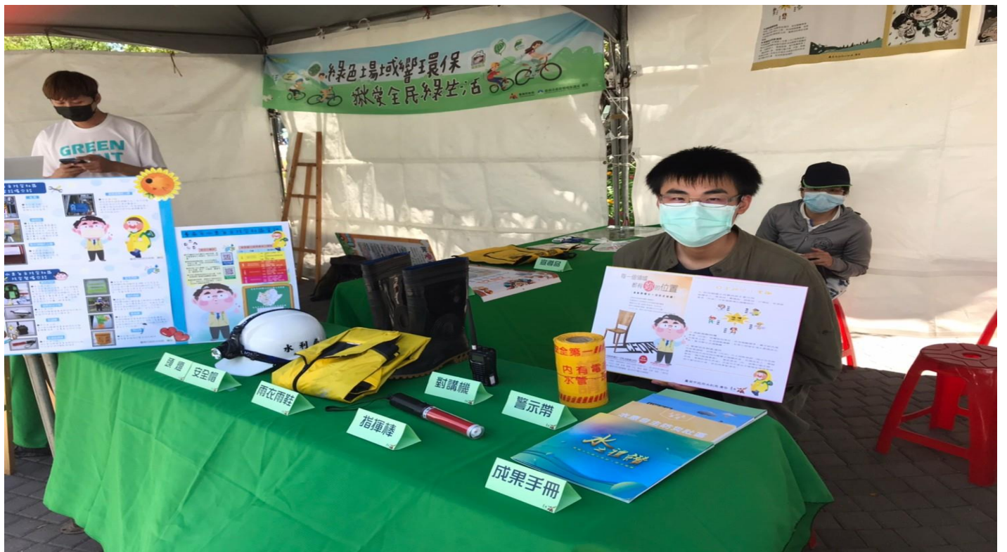
照片說明：結合水患自主防災業務製作 CEDAW 海報向民眾宣導。