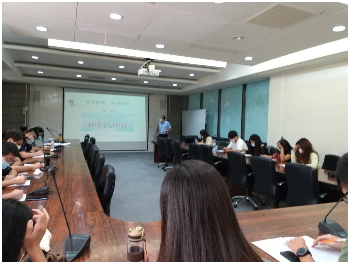
參訓人員進行後測中