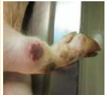
圖：關節腫脹伴隨皮膚壞死