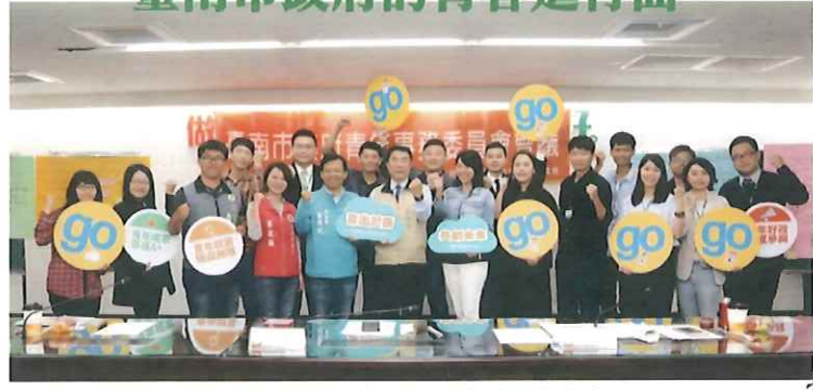
108年臺南市政府青年事務委員會成立