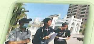
青年事務委員會工作小組現勘河樂廣場