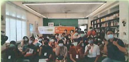
Let's Talk 南市青委邀青年談大學生實習議題