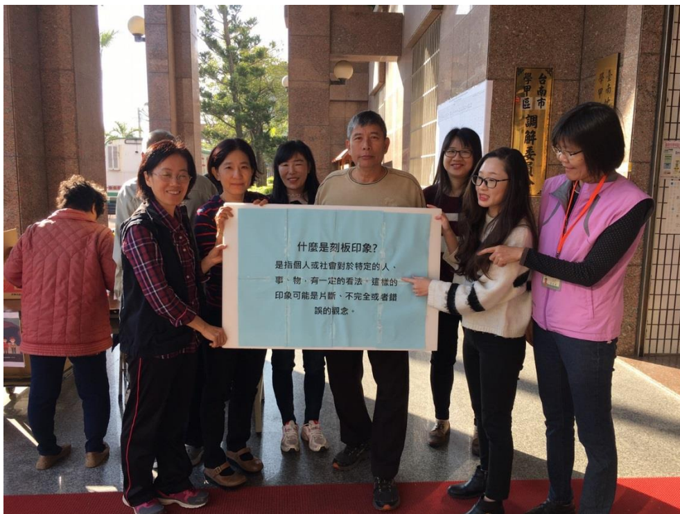
物資發放暨性平宣導