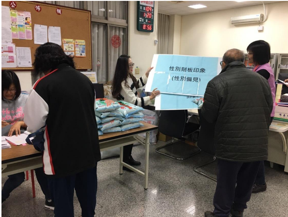
物資發放暨性平宣導