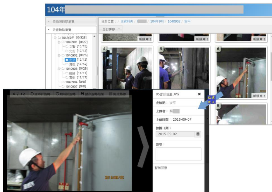
遠端工程管理系统示意圖-1

甲為某水利單位之技工，負責工程採購案件之現場施工監督、施工廠商資料審查、公文簽辦、驗收查驗及委外監造管理等業務，明知工程尚未竣工，卻於公文書上為「同意竣工」之記載。又明知監造廠商未派員至工地監工，卻未對此違約事項依約處罰，而趁機向廠商索賄，並接受廠商招待至有女陪侍之酒店飲酒作樂。為防堵類此情事發生，業已建立遠端系統，要求監造單位每日上傳工地照片和進度，以掌握狀況。另要求估驗案件需檢附遠端工程管理系统所提供的S曲線、施工照片、查驗點照片等佐證資料，強化內部控管作業。另派員進行現場查驗，且設置工程施工品質督導小組，加強三級品管制度，落實監造計畫檢視工程以控管品質。