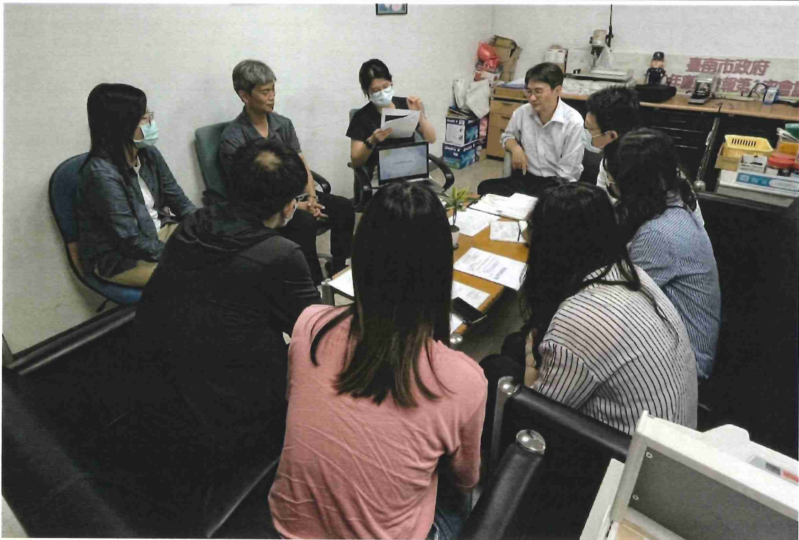
同仁聆聽內容及意見交流