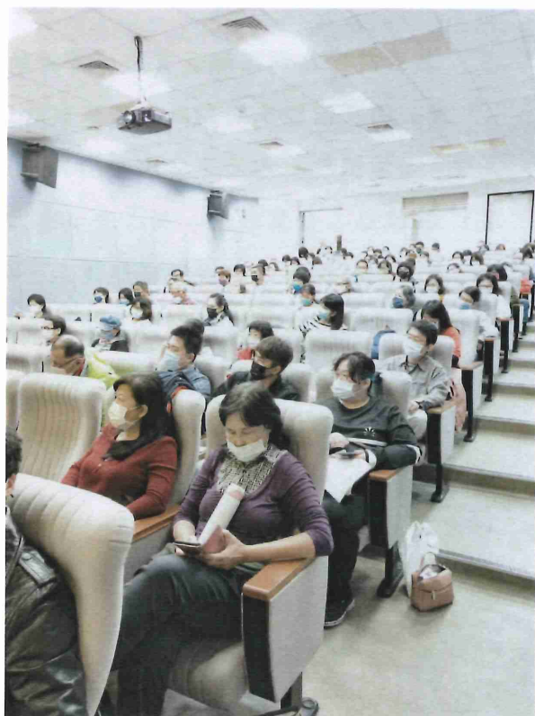
110 年度台南市社造計畫說明會與會人員