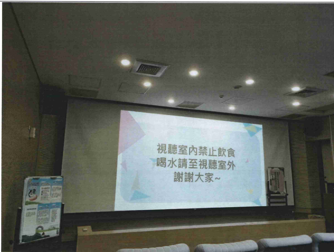
活動會場-將 cedaw 自製媒材置於講台左側