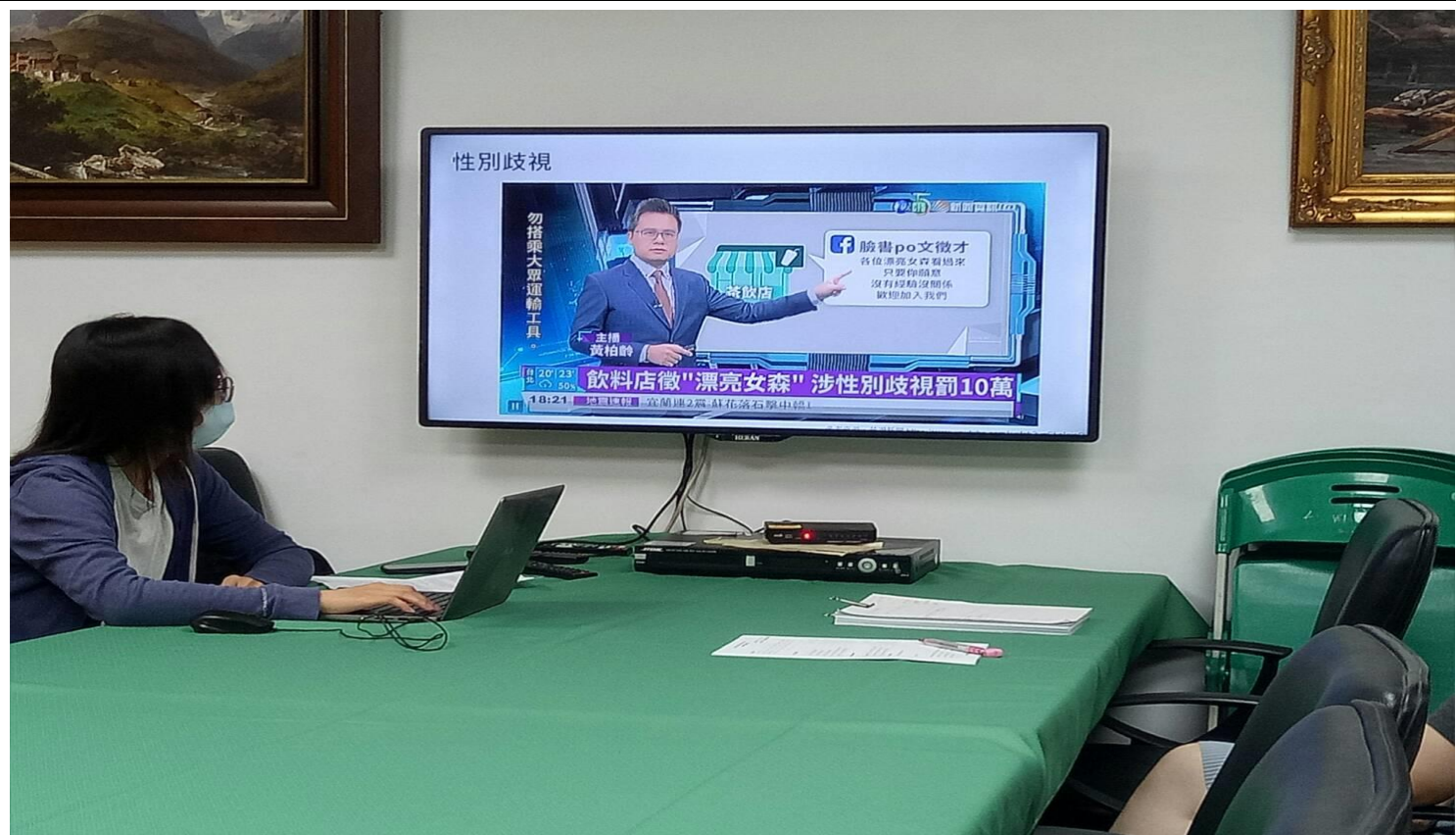
共學小組聆聽主講者講解「性別歧視」內容，並分享實際案例應用