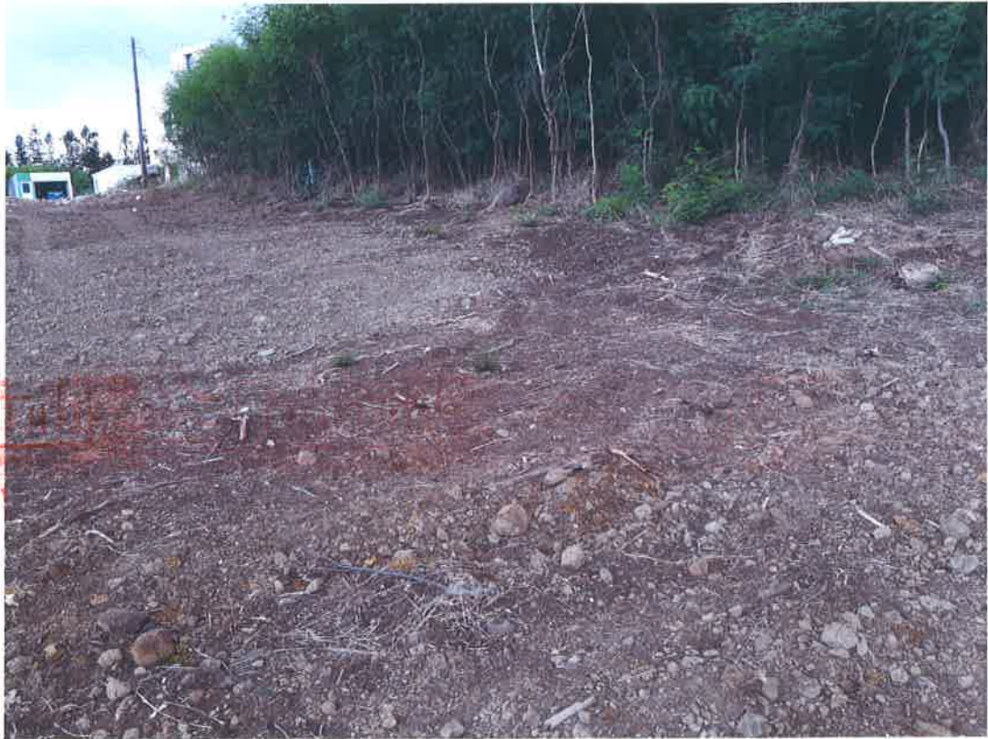
湖西南段第 1944 地號(照片左半邊)及第 1883 地號(照片右半邊)合景