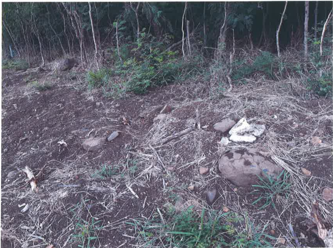
右邊白色石頭附近下方為湖西南段第 1883 地號之無主古墳受泥土掩覆處