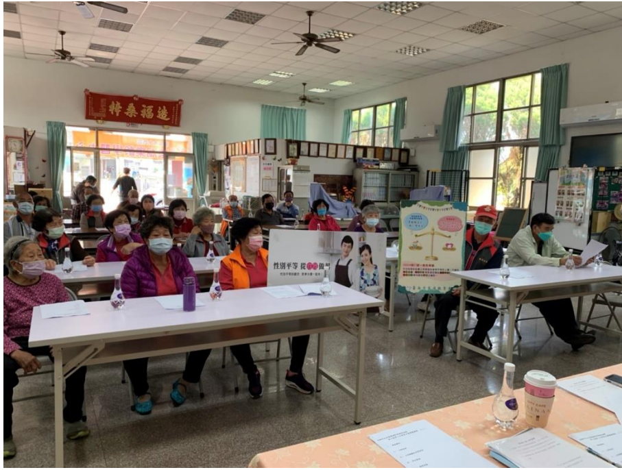
照片說明：以簡單看板形式宣導性別平等，讓性別平等概念走入社區