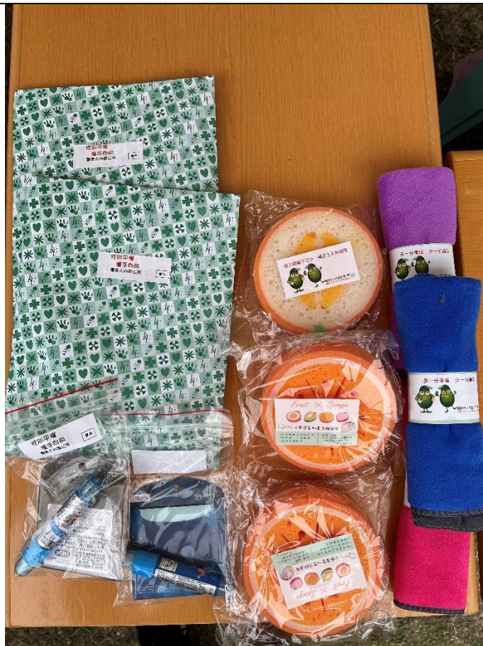
照片說明：「性別平等 攜手向前」宣導品發放