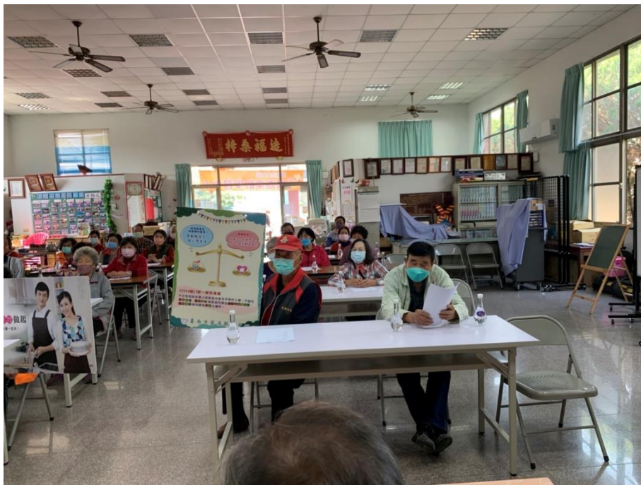
照片說明：以簡單看板形式宣導性別平等，讓性別平等概念走入社區