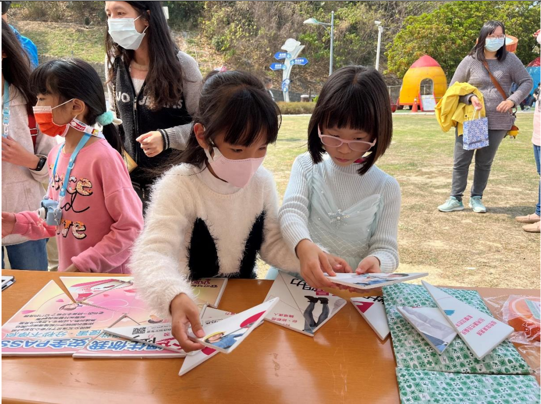
照片說明：透過性平拼圖《杜絕數位性暴力、促進女性參與 STEM(科學、技術、工程、數學)領域》闖關遊戲宣導性別平等