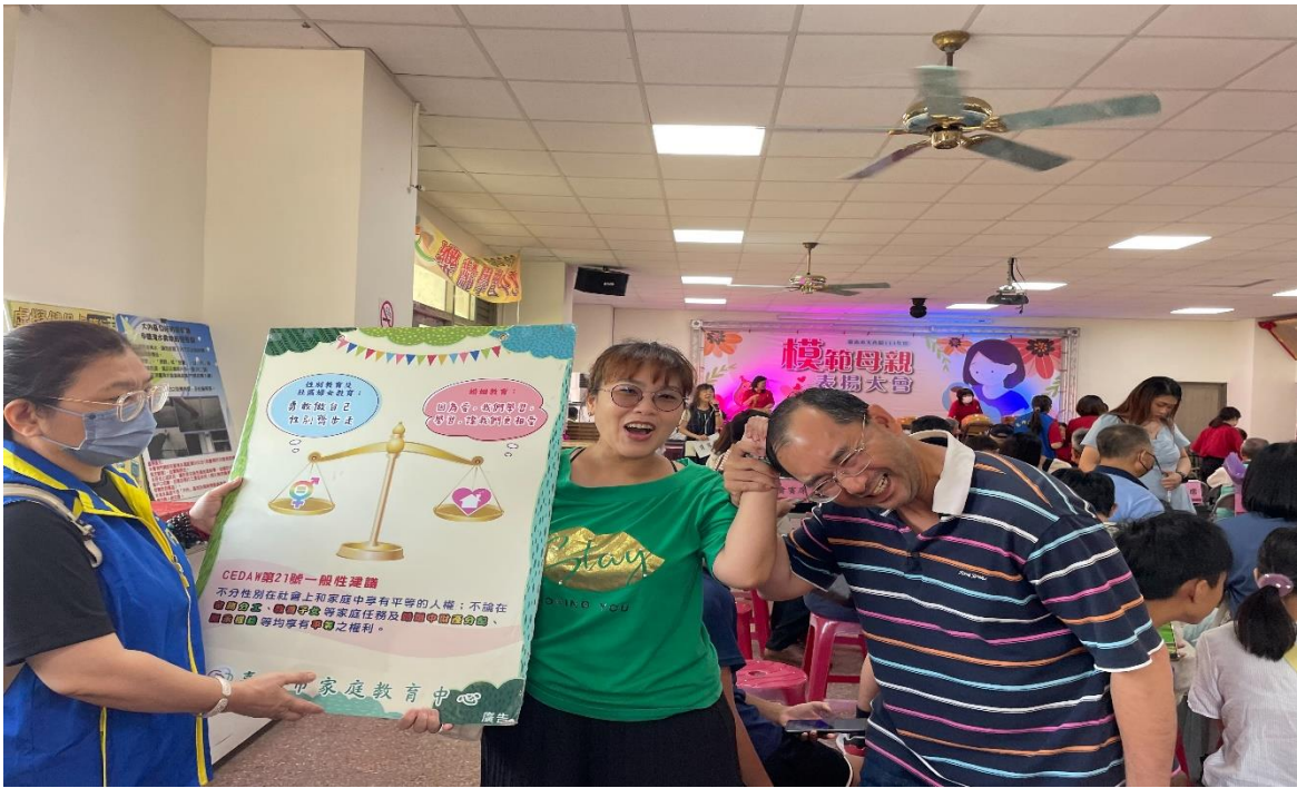
照片說明：113年模範母親表揚活動，藉由臺南市教育局-性別教育及婚姻教育製作之平面看板宣導CEDAW第_21_號一般性建議性別平等權利。