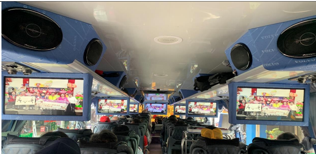
照片說明：辦理本所教育訓練時，播放本所自製性平影片。