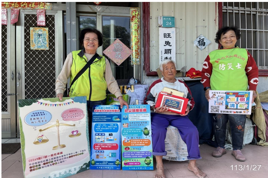
照片說明：本場次宣導於 113 年獨居老人慰訪，利用文宣看板以口頭方式向獨居老人說明此宣導文宣的核心主軸與介紹 CEDAW 第 21 號一般性建議內容及精神。