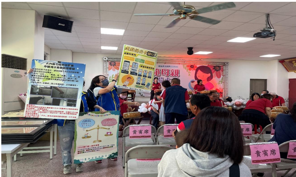
照片說明：113年模範母親表揚活動，藉由臺南市教育局-性別教育及婚姻教育製作之平面看板宣導CEDAW第_21_號一般性建議性別平等權利。