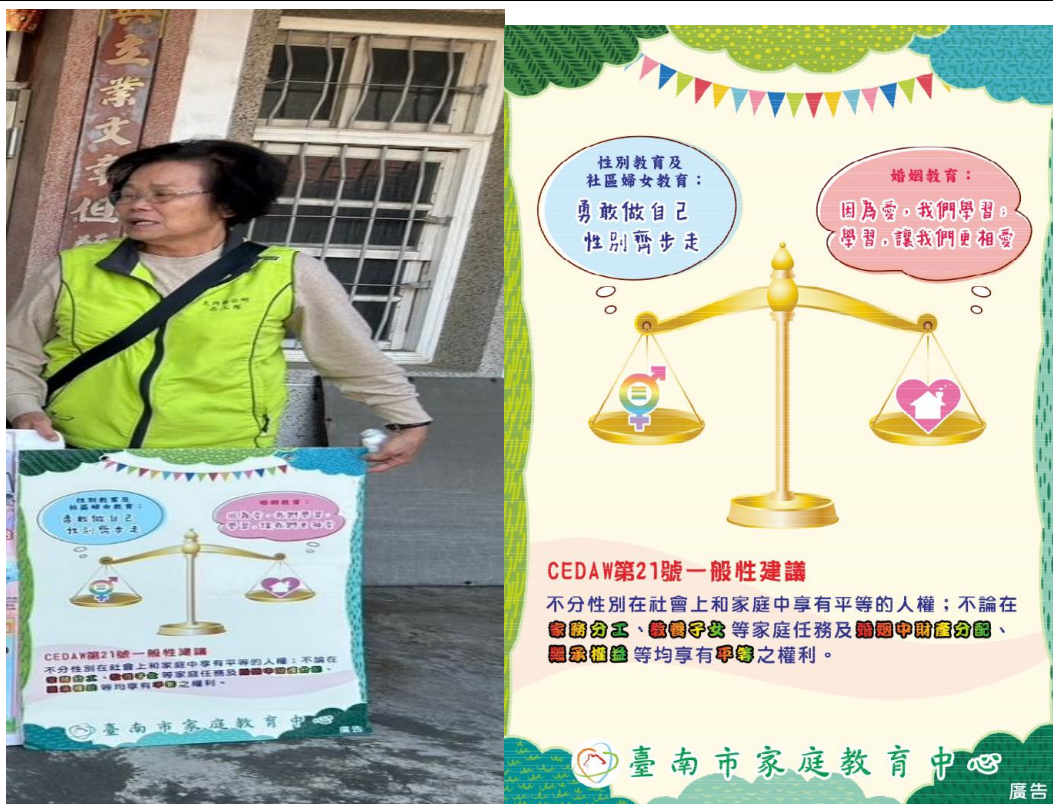
照片說明：本場次宣導於 113 年獨居老人慰訪，利用文宣看板以口頭方式向獨居老人說明此宣導文宣的核心主軸與介紹 CEDAW 第 21 號一般性建議內容及精神。