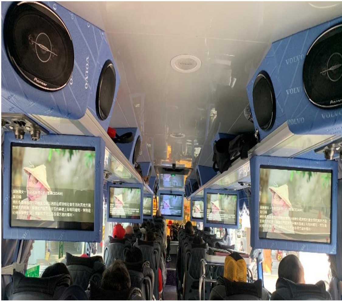
照片說明：辦理員工教育訓練時，播放本所自製性平影片。