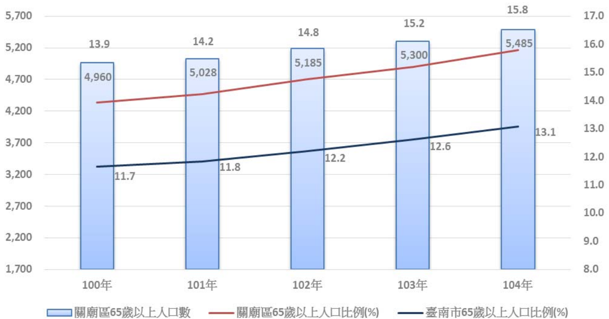
圖1 臺南市關廟區現住人口年齡65歲以上人數及比例 (含與臺南市全區比較)