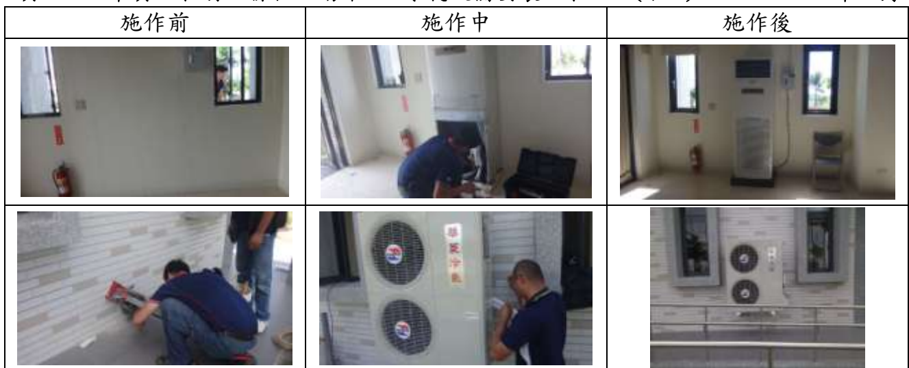
項次 1: 埤頭里下湖里聯合活動中心-冷氣設備安裝工程 5/2(左 1)