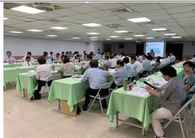
講師講述 CEDAW 重要概念與我國性別平等發展概況