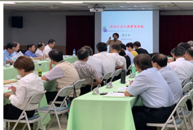
講師正在自我介紹並說明此性別平等推廣的重要性